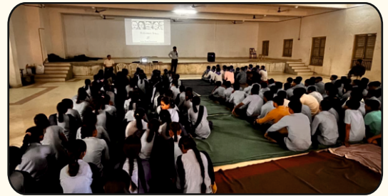
BAPS High School, Bochasan