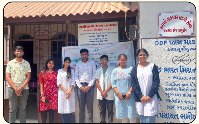
Samiyala Village, Vadodara