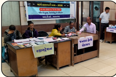
R. T. O Office, Bhavnagar