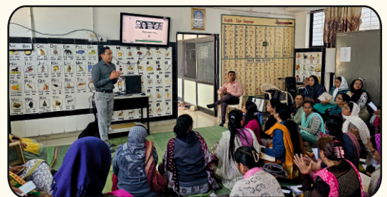
B.R.C. Bhavan, Dehgam