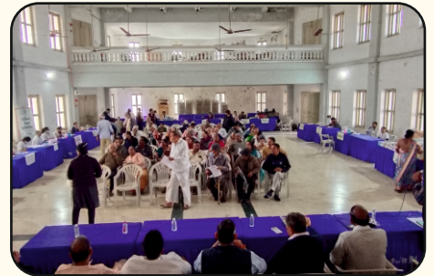
Kaliyabid Mega Health Checkup Camp, Bhavnagar