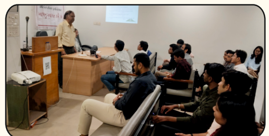
Surat Citizens Council Trust, Surat