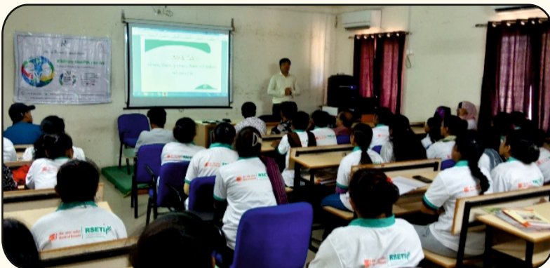
Bank of Baroda-Rural Self-Employment Training Institute, Mehsana