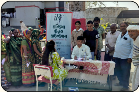
Memadpur village, Mehsana