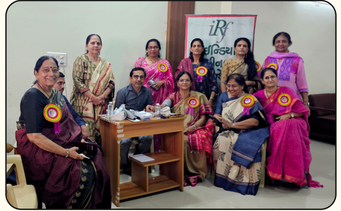
Kadava Patidar Parivar Mahila Vikas Trust, Ahmedabad