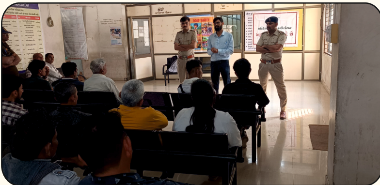
R.T.O. Office, Junagadh