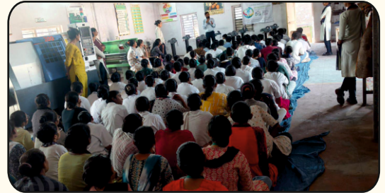
GHCL Foundation, Sutrapada, Junagadh