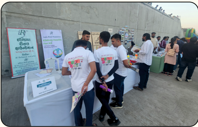
Sabarmati Riverfront, Ahmedabad