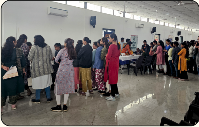
Shri Umiya KVC Education Trust, Ahmedabad