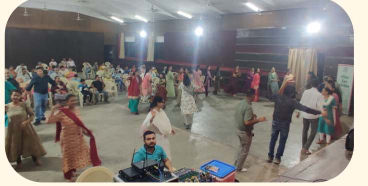
રાસ-ગરબાનો આનંદ માણતા પ્રેરણા સભ્યો