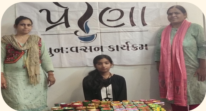
ફેન્સી દિવા સાથે પ્રેરણા સભ્યો

આમ પ્રેરણા મિત્રોના ચેહરા પર ખુશી લાવવાનો એક નમ્ર પ્રયાસ સંસ્થા દ્વારા કરવામાં આવ્યો હતો.