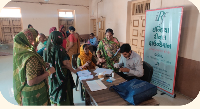
ગામ. સાકોદરા, તા. બાવળા, અમદાવાદ