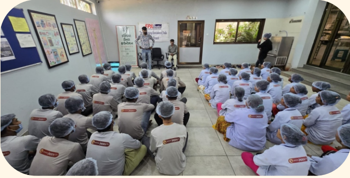
જયંત સ્નેક્સ એન્ડ બેવેરેજ્સ પ્રા. લિ., રાજકોટ