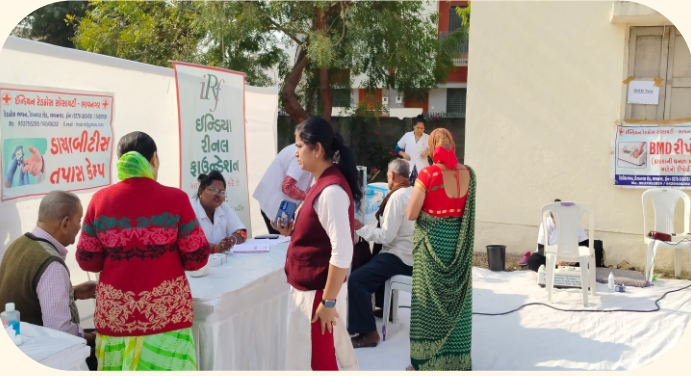
કાળિયાબીડ, ભાવનગર ખાતે મેગા કેમ્પ