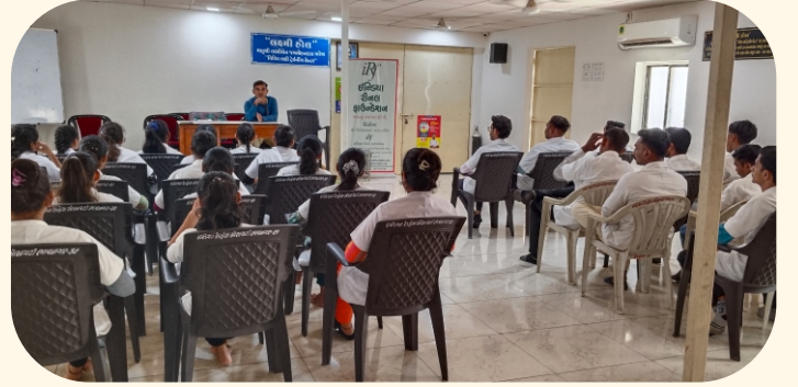
રેડકોસ સોસાયટી, ભાવનગર