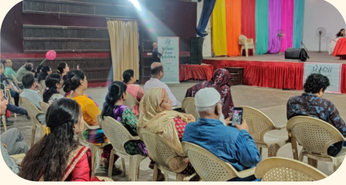
પ્રેરણા મિત્રોને મનોરંજન કરાવતા મ્યુઝિક લવર્સ ગ્રુપના સભ્યો