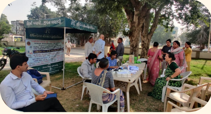
પોલિસ લાઇન, ગાંધીનગર

આ દિવસની ઉજવણીના ભાગરૂપે સંસ્થા દ્વારા ૧૪ થી ૨૦ નવેમ્બર ડાયાબિટીસ જાગૃતિ સપ્તાહ તરીકે ઉજવવામાં આવ્યું હતું અને વિવિધ જગ્યાઓ પર નિ:શુલ્ક તપાસ કેમ્પ અને સેમિનારનું આયોજન કરવામાં આવ્યું હતું.