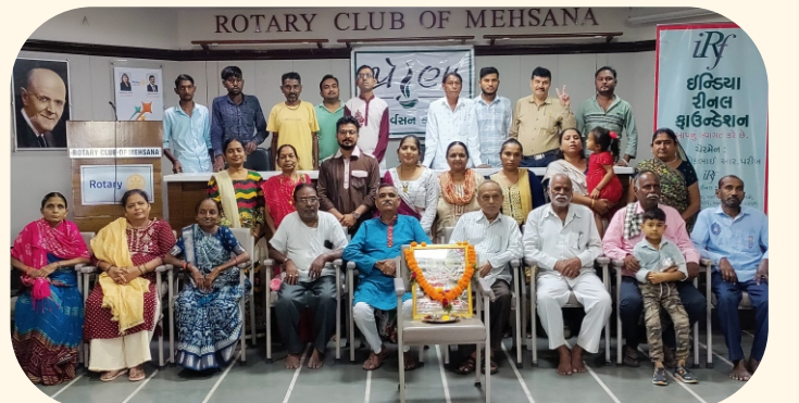
પ્રેરણા કાર્યક્રમ, મેહસાણા

તારીખ ૦૬ ઓક્ટોબર ૨૦૨૪ના રોજ ઇન્ડિયા રીનલ ફાઉન્ડેશન, મેહસાણા એપ્ટર દ્વારા પ્રેરણા સભ્યો માટે ફેન્સી દિવા અને ગરબા સ્પર્ધાનું આયોજન રોટરી ભવન હોલ ખાતે કરવામાં આવ્યું હતું જેમાં બહુ ઉત્સાહ સાથે પ્રેરણા સભ્યોએ ભાગ લીધો હતો. કાર્યક્રમ દરમિયાન સભ્યોએ પોતાને લેવી પડતી હિમોડાયાલિસીસની સારવારના અનુભવ રજૂ કર્યા હતા.