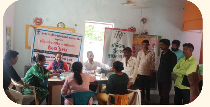
ગામ. મેમદપુર, જી. મહેસાણા