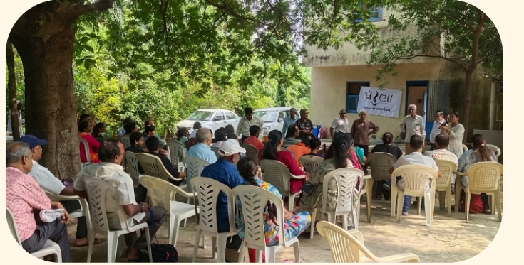
પ્રેરણા પિકનિક, વડોદરા