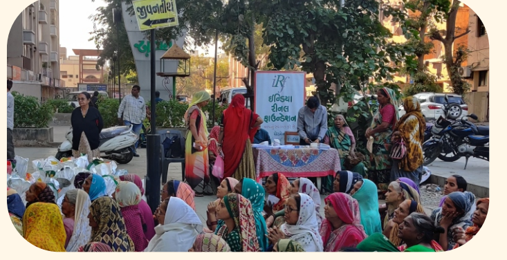
જીવનતીર્થ સંસ્થા, વાડજ, અમદાવાદ