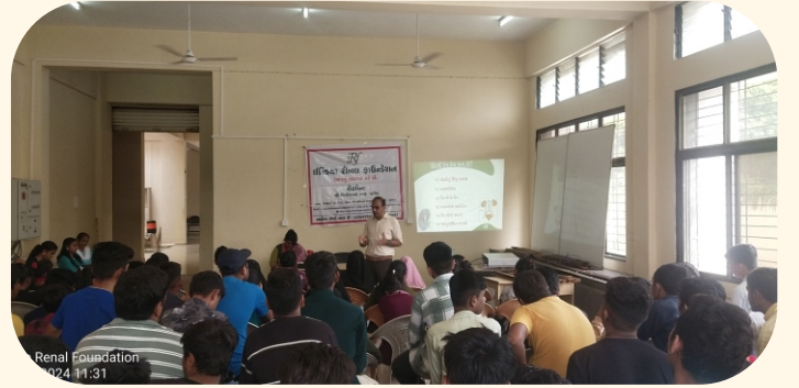
ગવર્મેન્ટ આઈ. ટી. આઈ., વડોદરા