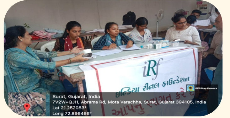
કરમશીબાપા ગુરુ આશ્રમ ખાતે મેગા કેમ્પ, સુરત