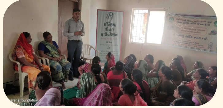
ગામ. સોનીપુર, જી. ગાંધીનગર