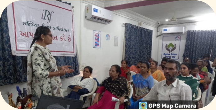
અપના ઘર ફાઉન્ડેશન, સુરત