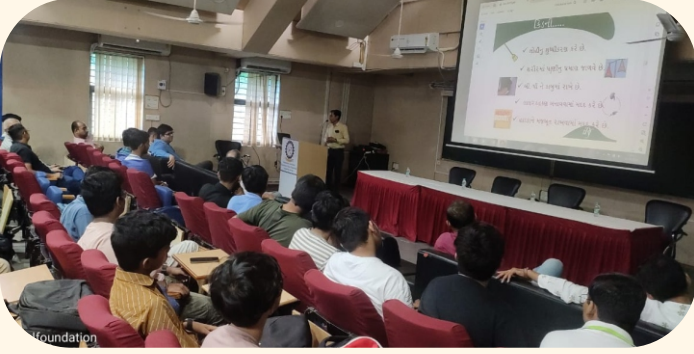
વિશ્વકર્મા એન્જિનિયરીંગ કોલેજ, ચાંદખેડા, અમદાવાદ