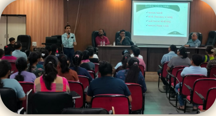
કામધેનુ યુનિવર્સિટી, હિમતનગર