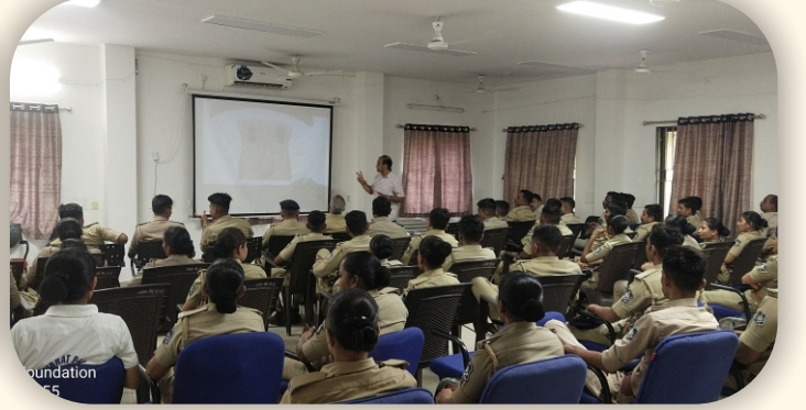
પોલીસ હેડ ક્વાર્ટર્સ, વડોદરા