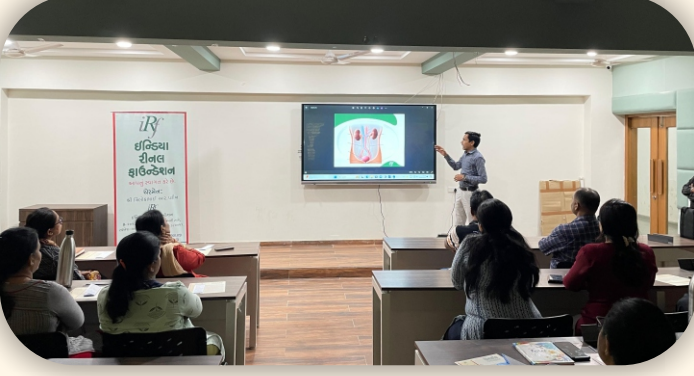
અમદાવાદ ટેકનિકલ યુનિવર્સિટી, અમદાવાદ