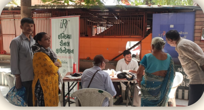
શ્રી ભુટ ભવાની મંદિર, અમદાવાદ