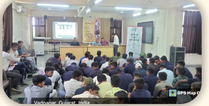
આઈ. ટી. આઈ., વડનગર