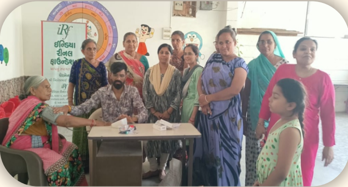
વાસુદેવ સ્કૂલ, રાજકોટ