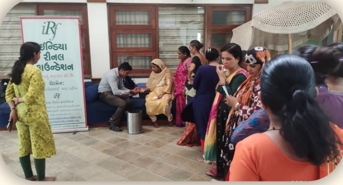
ફાફ્ટરૂટ્સ, લીલાપુર ગામ, ગાંધીનગર