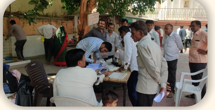
વિશ્વકર્મા પંચાલ સેવા સમાજ વાડી, અમદાવાદ