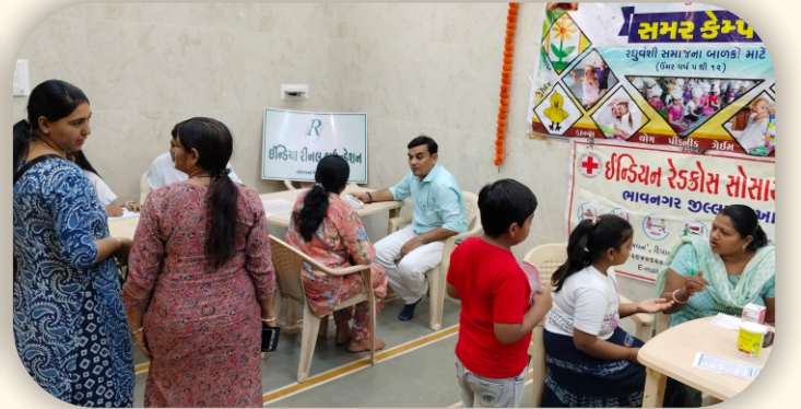
સમર કેમ્પ, લોહાણા મહાજન વાડી, ભાવનગર