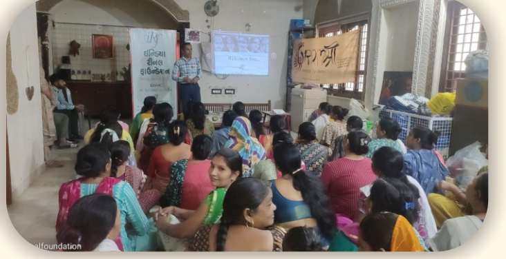
ગ્રામશ્રી ટ્રસ્ટ, અમદાવાદ