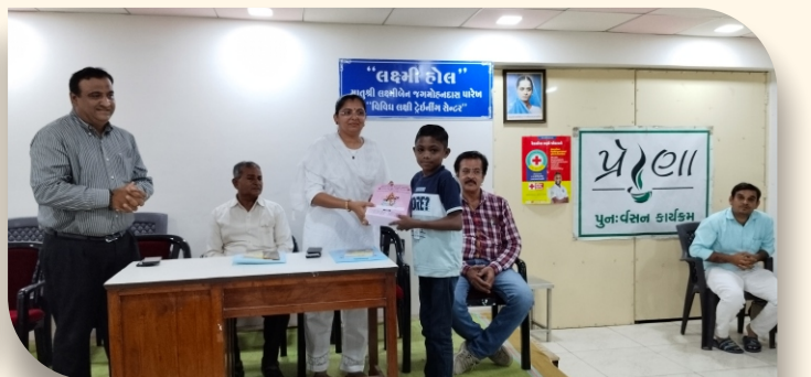
નોટબુક સ્વીકારતા પ્રેરણા સભ્યો અને તેમના સંતાનો