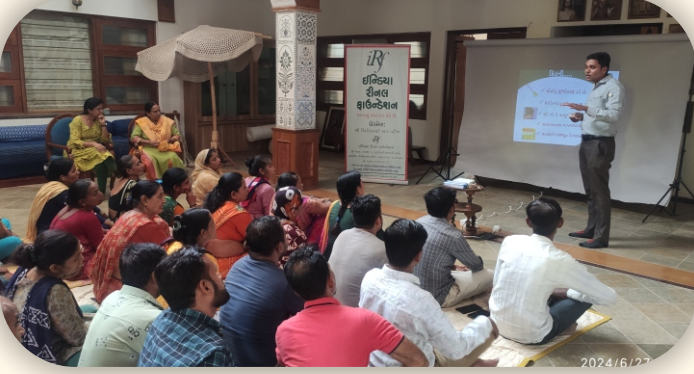
ફાસ્ટરૂટ્સ, લીલાપુર ગામ, ગાંધીનગર