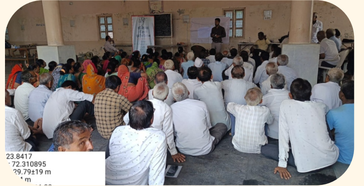
ગામ-અમુધ, તા. ઊંઝા, જી.- મહેસાણા