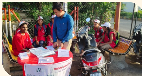
અંગદાન સંકલ્પ પત્રો ભરાવતા સ્વયંસેવકો