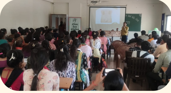
ધોળકા એજ્યુકેશન ટ્રસ્ટ, ધોળકા, અમદાવાદ