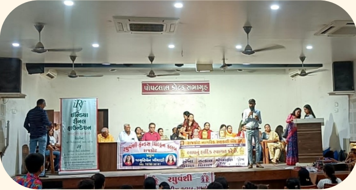
કોટક સ્કૂલ, રાજકોટ