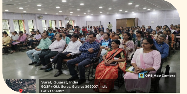
Surat, Gujarat, India 5Q3P+X6J, Surat, Gujarat 395007, India Lat 21.15499°