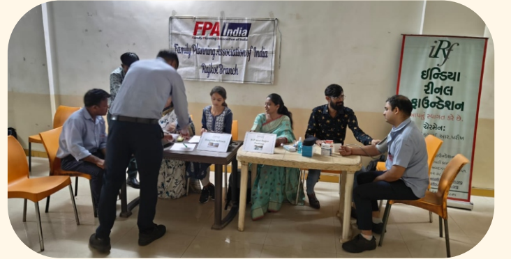
રોલેક્સ રિગ્સ લિમિટેડ, રાજકોટ