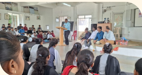
DIET, ભાવનગર ખાતે અંગદાન જાગૃતિ કાર્યક્રમ

સાંજે ૫ થી ૬:૩૦ દરમિયાન જોગર્સ પાર્ક, આતાભાઈ ચોક ભાવનગર અને ઘોઘાગેટ ભાવનગર ખાતે અંગદાન, ચક્ષુદાન, દેહદાન માટેના સંકલ્પપત્રો ભરીને કેડેવરિક અંગદાન જાગૃતિ પત્રિકાનું વિતરણ કરીને આ વિષય પર જાગૃતિ લાવવાનો પ્રયાસ કરવામાં આવ્યો હતો.