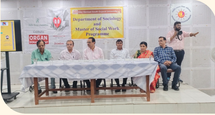
અંગદાન જાગૃતિ કાર્યક્રમ, સુરત

સંસ્થાના સુરત ચેપ્ટર દ્વારા આ દિવસે વીર નર્મદ દક્ષિણ ગુજરાત યુનિવર્સિટીના માસ્ટર ઓફ સોશિયલ વર્ક (એમ.એસ.ડબલ્યુ) અને સમાજશાસ્ત્ર વિભાગના સહયોગથી પ્રિવેન્શન ઓફ કિડની ડિસીઝ અને કેટેવરિક અંગદાન જાગૃતિ કાર્યક્રમનું આયોજન કરવામાં આવ્યું હતું. એમ.એસ.ડબલ્યુ અને સમાજશાસ્ત્ર વિભાગના અધ્યાપકશ્રીઓ, સ્ટાફ અને વિદ્યાર્થીઓએ આ કાર્યક્રમમાં ખૂબ જ ઉત્સાહથી ભાગ લીધો હતો. કાર્યક્રમના મુખ્ય મહેમાન તરીકે વીર નર્મદ દક્ષિણ ગુજરાત યુનિવર્સિટીના કુલપતિ શ્રી ડો. કિશોરસિંહ એન. ચાવડા અને મુખ્ય વક્તા તરીકે શહેરના જાણીતા નેફ્રોલોજિસ્ટ ડો. દીપક તમાકુવાલા ઉપસ્થિત રહ્યા હતા. ડો. તમાકુવાલાએ ખૂબ જ સરળ ભાષામાં કિડની અને કેટેવર અંગદાન વિશે વિગતવાર માહિતી આપી હતી.