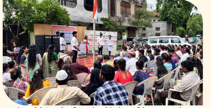
સ્વાતંત્ર્ય પર્વની ઉજવણી દરમિયાન શ્રીતાઓને અંગદાન વિષે જાગૃત કરવામાં આવ્યા

૧૫ ઓગષ્ટ ૨૦૨૪ના રોજ બરોડા ઇન્સ્ટિટ્યૂટ ઓફ મેડિકલ સાયન્સ (BIMS) ખાતે સ્વાતંત્ર્ય પર્વની ઉજવણી દરમિયાન ઇન્ડિયા રીનલ ફાઉન્ડેશન દ્વારા વિશ્વ અંગદાન દિવસની ઉજવણીના અનુસંધાનમાં કેટેવર અંગદાન વિષે જાગૃતિ કાર્યક્રમનું આયોજન કરવામાં આવ્યું હતું. આ કાર્યક્રમમાં ધાર્મિક-સામાજિક સંસ્થાઓ માંથી પધારેલા મહાનુભાવો, શિક્ષકો, BIMSના ટ્રસ્ટીશ્રીઓ તેમજ વિદ્યાર્થીઓ હાજર રહ્યા હતા અને સર્વેએ અંગદાનનો સંકલ્પ કર્યો હતો.