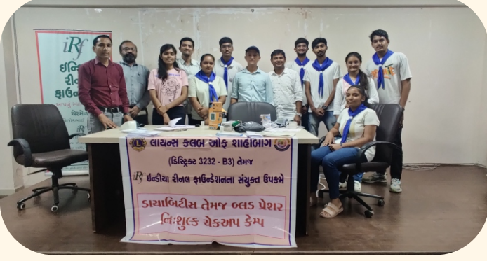
આર.સી ટેકનિકલ કોલેજ, અમદાવાદ