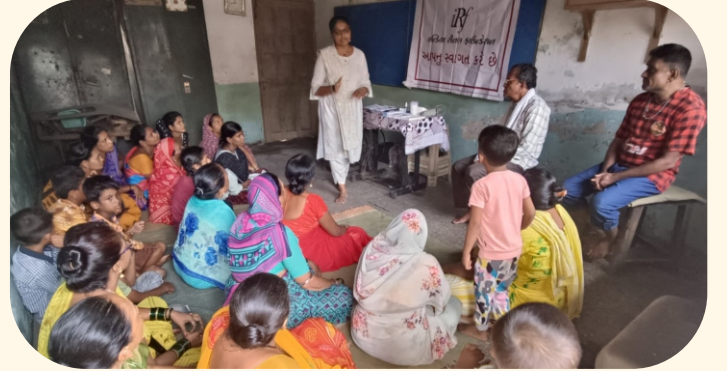
નાગસેનનગર, પાંડેસરા, સુરત