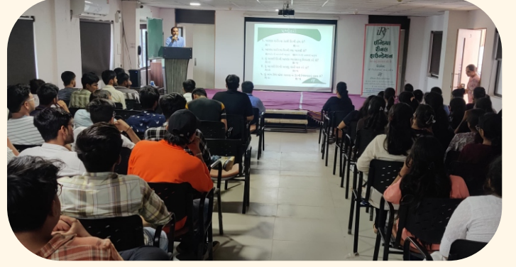
સરસ્વતી ઈન્સ્ટિટ્યૂટ ઓફ ફાર્માસ્યુટિકલ સાયન્સ, ગાંધીનગર