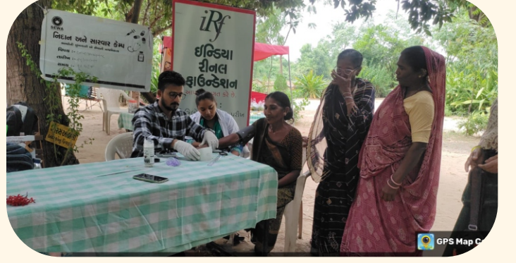
ગામ-ગણેશપુરા, તા. કડી, જી. મહેસાણા