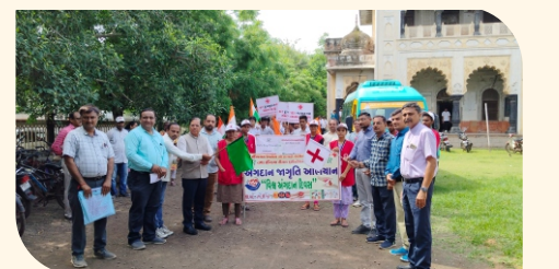
અંગદાન જાગૃતિ રેલી