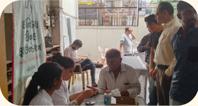
ડાયમંડ ઓફિસ, ભાવનગર