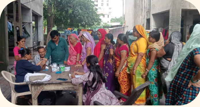
સિદ્ધાર્થ નગર, બાટલીબોચ, સુરત