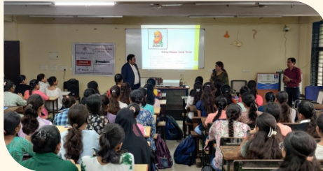
સેઠ આર. એ ભવન સેઠ આર.એ કોલેજ, અમદાવાદ