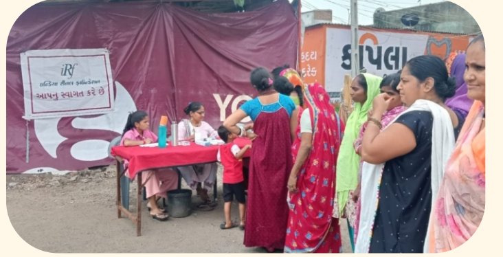
ઉનપાટિયા વિસ્તાર, સુરત