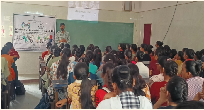
એમ.જે કુંડલિયા કોલેજ, રાજકોટ