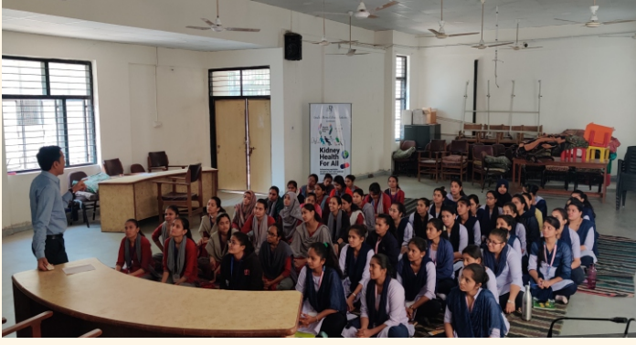
જિલ્લા શિક્ષણ અને તાલીમ ભવન, અમદાવાદ