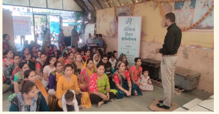
મંગળ પ્રભાત સોસાયટી, વાડજ, અમદાવાદ