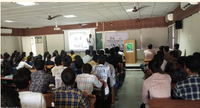
આણંદ એગ્રીકલ્ચર યુનિવર્સિટી, આણંદ