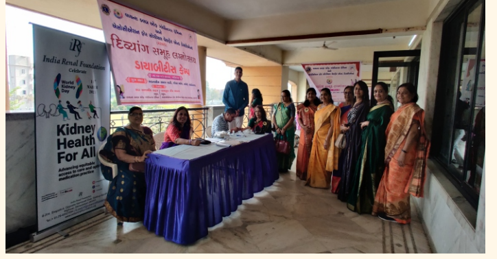
દિવ્યાંગ સમૂહ લક્ષોત્સવ, ગાંધીનગર