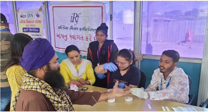
લોક વિકાસ સંસ્થા, હજુરા, સુરત