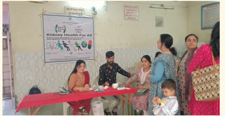
ગિરનાર સોની સમાજ વાડી, જામનગર