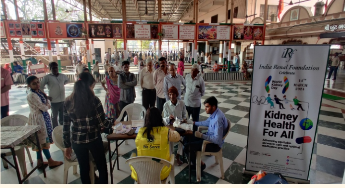
બૂટ ભવાની મંદિર, વેજલપુર, અમદાવાદ