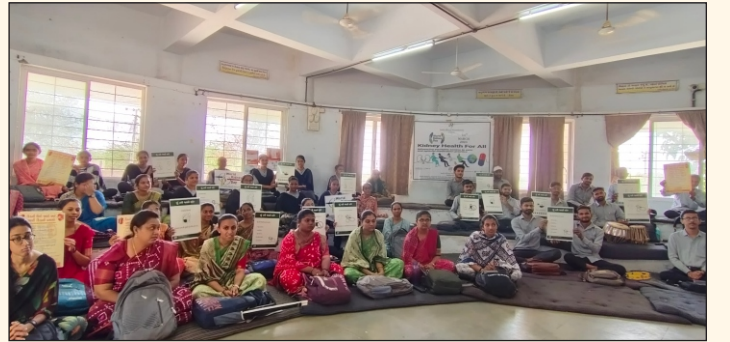
જિલ્લા શિક્ષણ તાલીમ ભવન, ભાવનગર