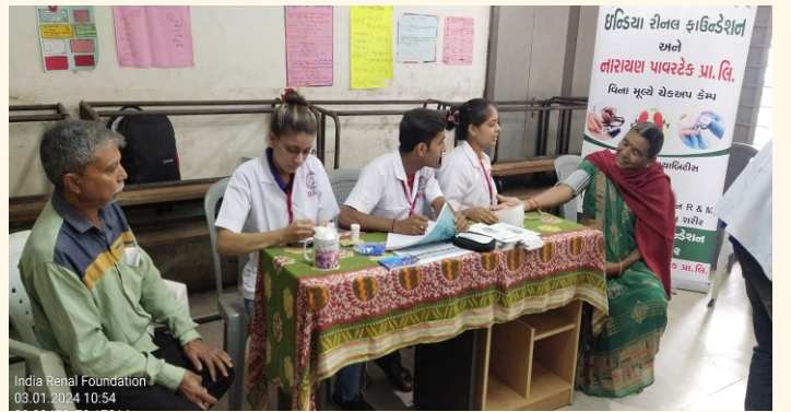
ગામ. મારેહા, જી. વડોદરા