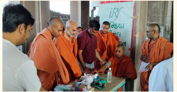
સ્વામિનારાયણ મંદિર, ભાવનગર