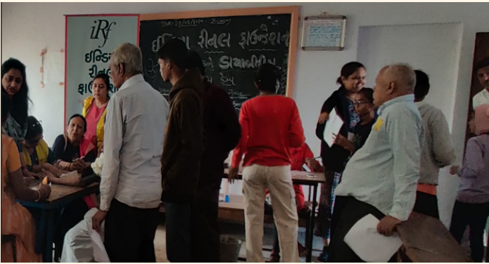
ગામ. નેનપુર, તા. મહેમદાવાદ, જી. પેડા