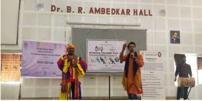
કિડની જાગૃતિ ભવાઈ