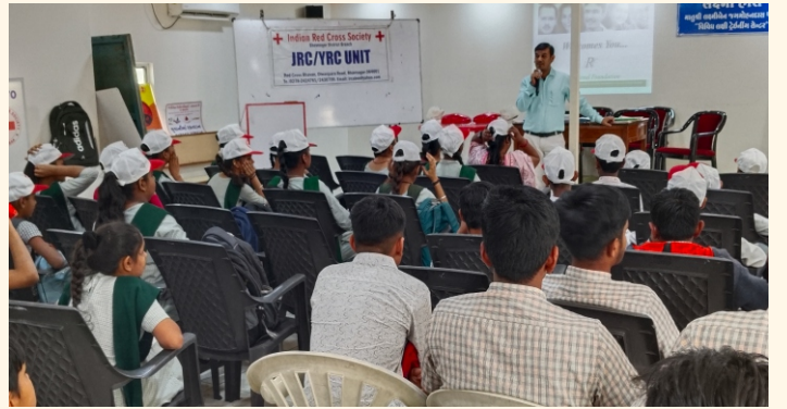
ઈન્ડિયન રેડક્રોસ સોસાયટી, ભાવનગર