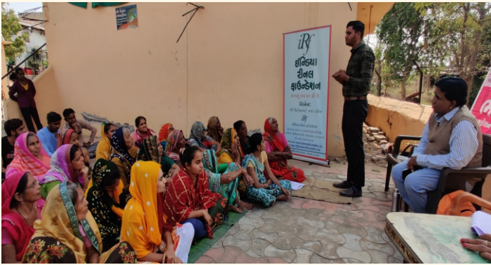
ગામ. બદપુરા, જી. ગાંધીનગર