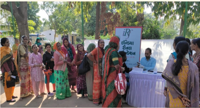
ગામ. ગણેશપુરા, જી. મહેસાણા