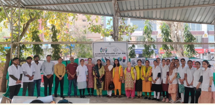
કિડની દિવસની ઉજવણીમાં ભાગ લેતા વિદ્યાર્થીઓ અને વૉલન્ટીયર્સ

વિશ્વ કિડની દિવસ ની ઉજવણીના ભાગરૂપે ૧૪ માર્ચ ૨૦૨૪, ગુરુવારના રોજ વિશ્વ કિડની દિવસે શ્રી ઝૂં કારેશ્વર મહાદેવ મંદિર, જોધપુર ગામ, અમદાવાદ ખાતે જે. જી. ઈન્ટરનેશનલ નર્સિંગ કોલેજના વિદ્યાર્થીઓના સહયોગથી કિડની જાગૃતિ પોસ્ટર પ્રદર્શન, બીપી, ડાયાબિટીસ અને કિડની તપાસ કેમ્પનું આયોજન કરવામાં આવ્યું હતું. વિદ્યાર્થીઓએ દર્શનાર્થે આવતા દરેક નાગરિકોને પોસ્ટર દ્વારા કિડનીના રોગ વિશે જાગૃત કરીને કિડની જેવા મહત્વના અંગને નુકસાન કરતાં બ્લડપ્રેશર અને ડાયાબિટીસ જેવા રોગની સ્થળ ઉપર જ તપાસ કરવામાં આવી હતી અને જરૂર જણાતા દર્દીઓને બંને રોગની સારવાર માટે યોગ્ય માર્ગદર્શન આપવામાં આવ્યું હતું.