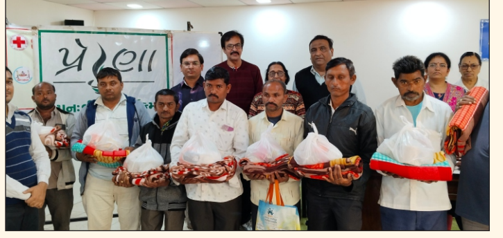
અનાજ કિટ મેળવતા પ્રેરણા સભ્યો

ભાવનગર ચેપ્ટર દ્વારા પ્રેરણા કાર્યક્રમ અંતર્ગત ૨૦ જાન્યુઆરી ૨૦૨૪ના રોજ ઈન્ડિયન રેડક્રોસ સોસાયટી ભાવનગરના સહયોગથી કિડનીના દર્દીઓને અનાજ કિટ અને ગરમ ધાબળાનું વિતરણ કરવામાં આવ્યું હતું. આ માટે અમે ઈન્ડિયન રેડક્રોસ સોસાયટી ભાવનગરના આભારી છીએ.