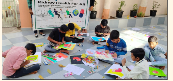
ચિત્ર સ્પર્ધામાં ભાગ લેતા વિદ્યાર્થીઓ