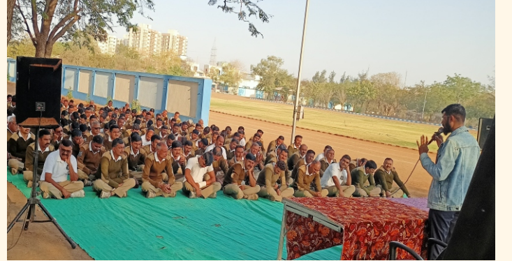
કિડની રોગ વિશે માહિતી મેળવતા એસ.આર.પી.એફના જવાનો