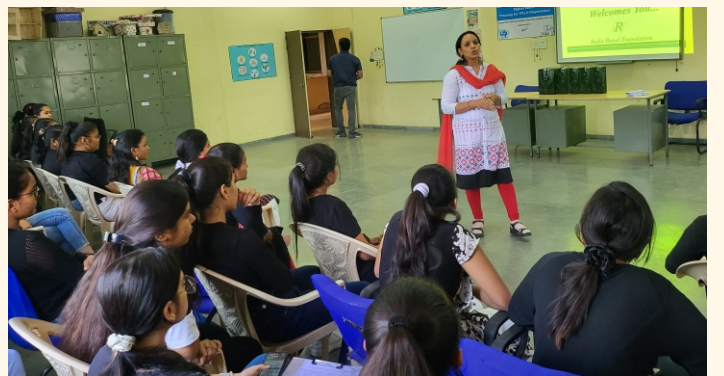
મહિલા આઈ.ટી.આઈ., સુરત