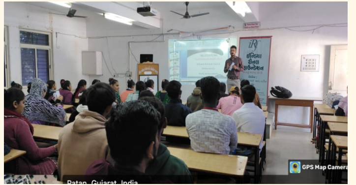
એમ.એસ.ડબલ્યુ. કોલેજ, પાટણ, મહેસાણા