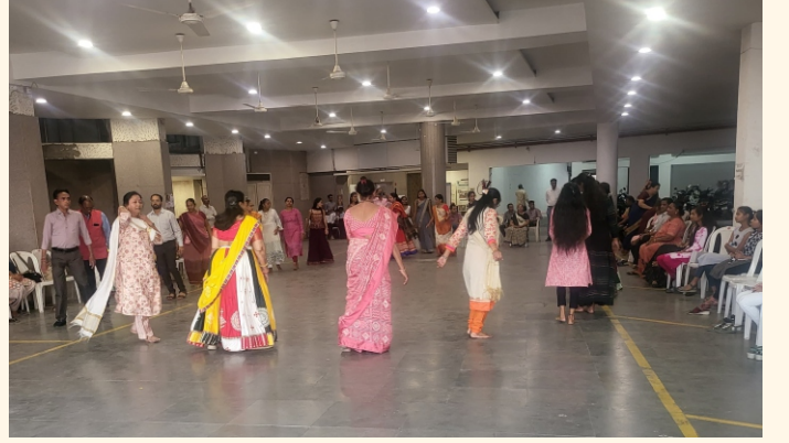
ગરબાની મઝા માણતા પ્રેરણા સભ્યો