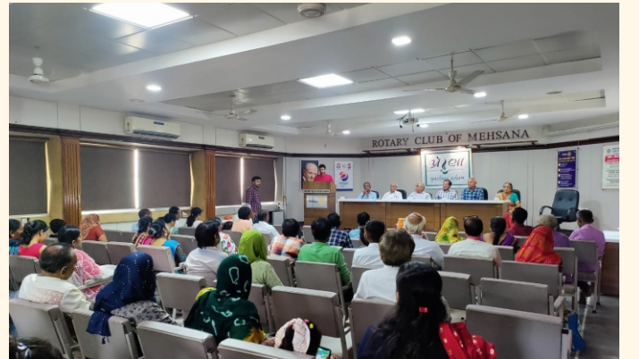
પ્રેરણા કાર્યક્રમ, મહેસાણા