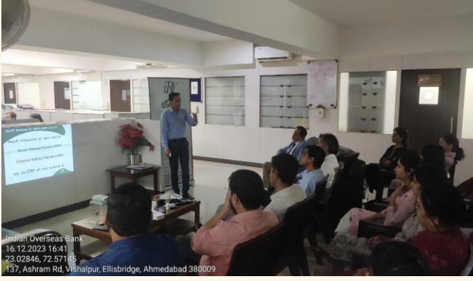
ઇન્ડિયન ઓવરસીઝ બેન્ક હેડ ઓફિસ, અમદાવાદ