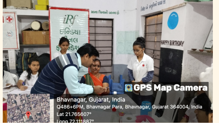
હાઇનગર સ્કૂલ, ભાવનગર