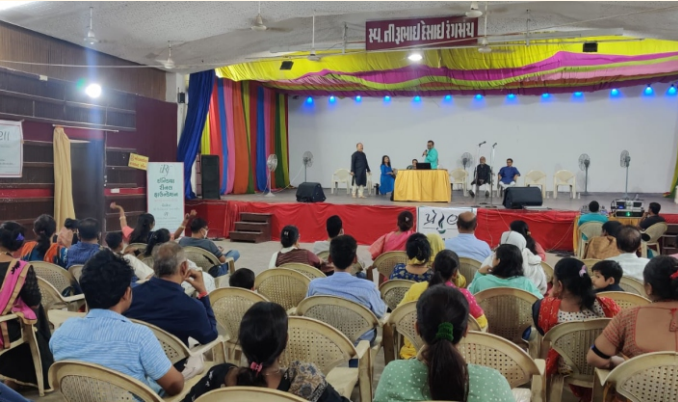
પ્રેરણા મિત્રોને મનોરંજન કરાવતા મ્યુઝિક લવર્સ ગ્રૂપના સભ્યો