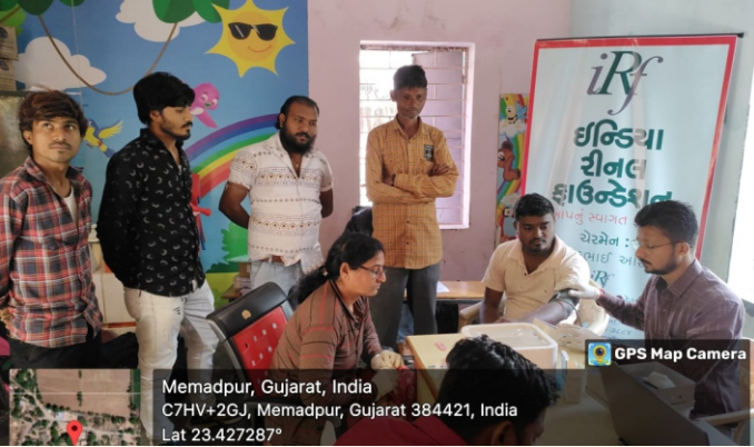
ગામ-મેમદપુર, તા.-જોટાણા, જી.-મહેસાણા