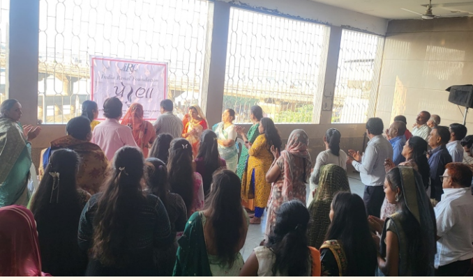
આરતીમાં જોડાયેલ પ્રેરણા સભ્યો

તારીખ ૨૯ ઓક્ટોબર ૨૦૨૩ ના રોજ 'પ્રેરણા' કાર્યક્રમ અંતર્ગત પ્રેરણામિત્રો માટે રાસ-ગરબા અને કેટવોક સ્પર્ધાનું આયોજન કરવામાં આવ્યું હતું. સૌપ્રથમ જગત જનની માં અંબેની આરતીથી કાર્યક્રમની શરૂઆત કરવામાં આવી પછી સૌ પ્રેરણા સભ્યો મન ભરીને ઉત્સાહપૂર્વક ગરબે ધૂમ્મા હતા. ત્યારબાદ કેટવોક સ્પર્ધા કરવામાં આવી હતી જેમાં ભાગ લેનાર દરેક પ્રેરણા સભ્યોને પ્રોત્સાહનરૂપે ઈનામ વિતરણ કરવામાં આવ્યું. કાર્યક્રમના અંતે રાષ્ટ્રગીત ગાઈને સૌએ સાથે રાત્રિભોજન લીધું હતું.