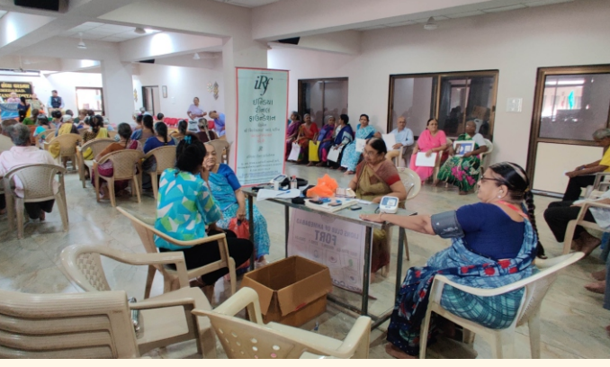
જીવન સંઘ્યા ઓલ્ડ એજ હોમ, અમદાવાદ