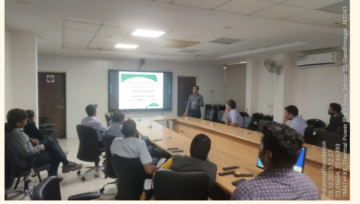
યુ.જી.વી.સી.એલ હેડ ઓફિસ, ગાંધીનગર