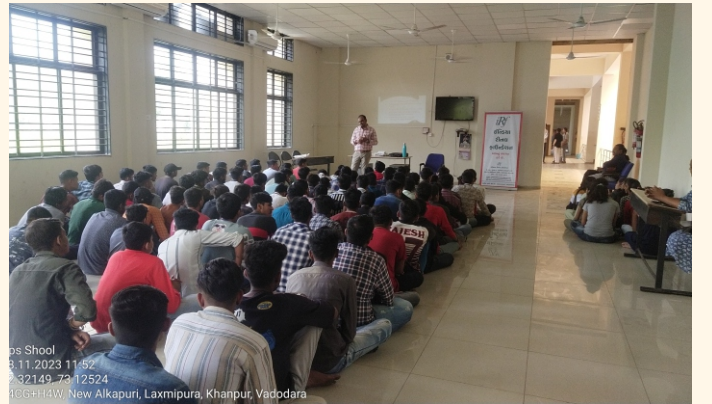
સરકારી આઈ.ટી.આઈ, ગોત્રી, વડોદરા