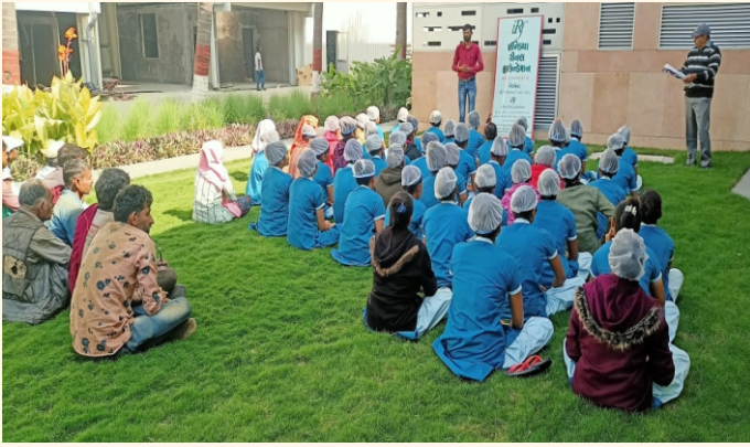
બાલાજી વેફર્સ પ્રાઇવેટ લિમિટેડ, રાજકોટ