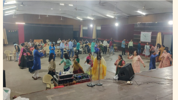
રાસ-ગરબાનો આનંદ માણતા પ્રેરણા સભ્યો