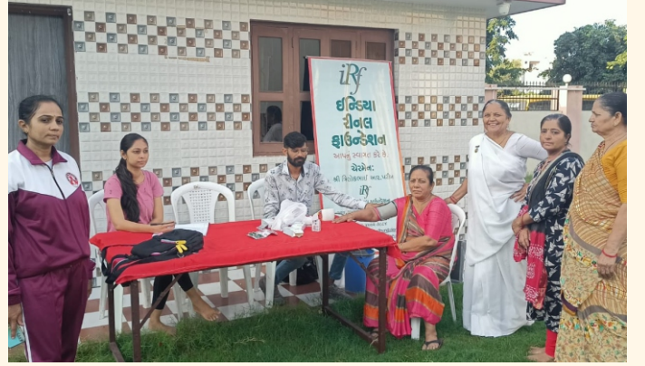
શક્તિ સોસાયટી, રાજકોટ