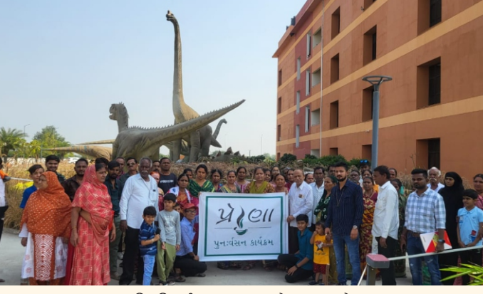
પિકનિકની મઝા માણતા પ્રેરણા સભ્યો