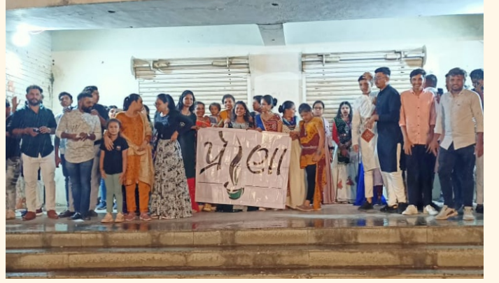
આજકાલ નવરાત્રી મહોત્સવમાં ભાગ લેતા પ્રેરણા મિત્રો

ઈન્ડિયા રીનલ ફાઉન્ડેશન રાજકોટ દ્વારા 'આજકાલ' નવરાત્રી ગરબા મહોત્સવના આયોજકોના સહયોગથી વિના મૂલ્યે પ્રેરણા સભ્યો, તેમના પરિવારજનો અને ડાયાલિસિસ ટેકનિશિયન મિત્રો માટે તારીખ ૧૪ ઓક્ટોબર ૨૦૨૩ના રોજ 'ગરબા' કાર્યક્રમનું આયોજન કરવામાં આવ્યું હતું. જેમાં ઉત્સાહપૂર્વક દરેકે ભાગ લીધો હતો.