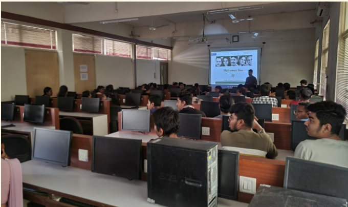
સાર્વજનિક બી.સી.એ. કોલેજ, મહેસાણા