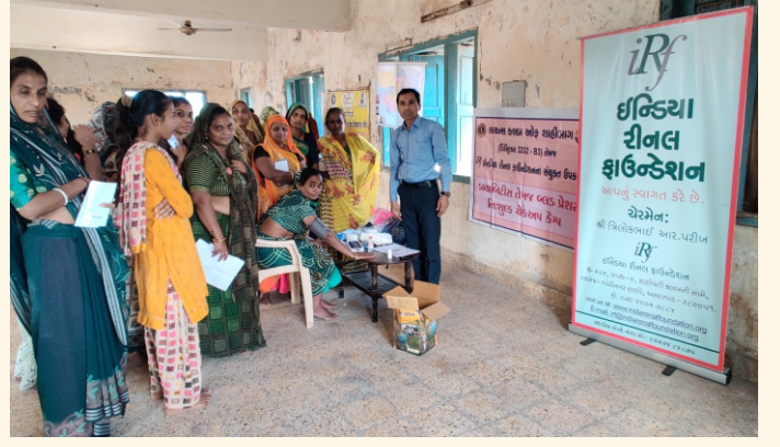
ગામ- વડુસ્વામી, તા.- કલોલ, જી.- ગાંધીનગર