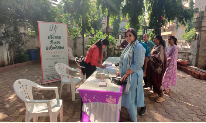
દીપ એવન્યુ સોસાયટી શાહીબાગ, અમદાવાદ