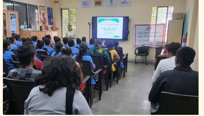
અંબુજા સિમેન્ટ ફાઉન્ડેશન, સુરત