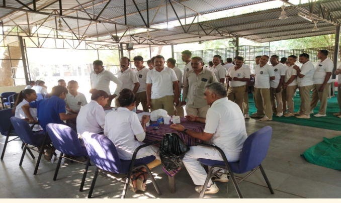
કેમ્પમાં ભાગ લેતા ગુજરાત પોલીસના જવાનો