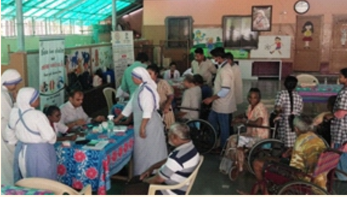
મિશનરીઝ ઓફ ચેરિટી, વડોદરા