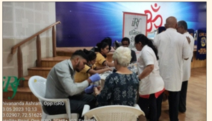
શિવાનંદ આશ્રમ, સેટેલાઈટ, અમદાવાદ