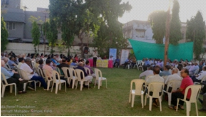
બેંક ઓફ ઇન્ડિયાના રીટાયર્ડ કર્મચારીગણ, ભીમનાથ મહાદેવ મંદિર, અમદાવાદ