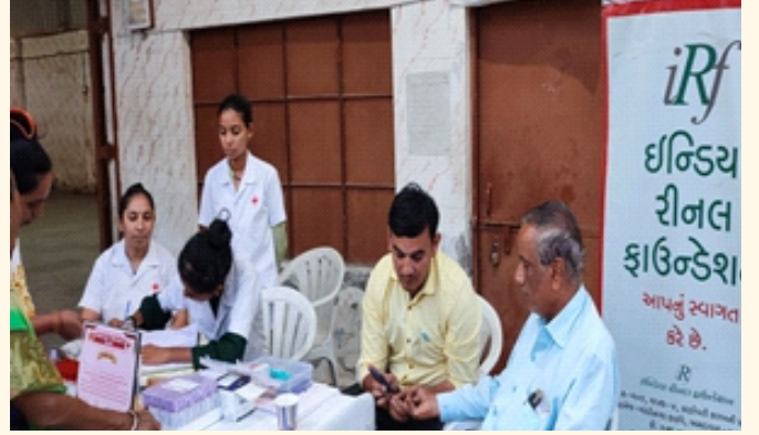
જલારામ મંદિર, ભાવનગર