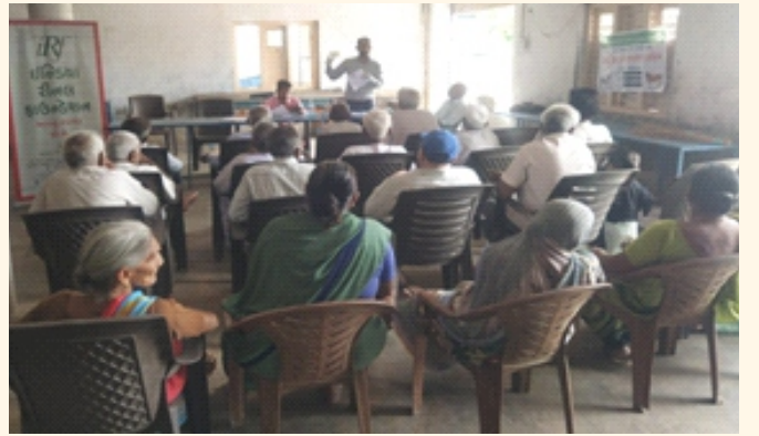
ગામ.-વિશોલ, તા.- ઊંઝા, જી.- મહેસાણા