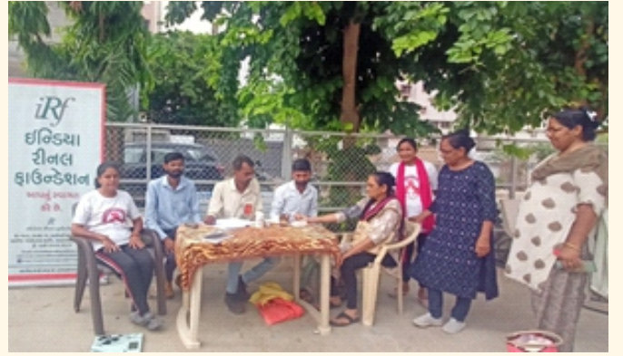
સોમનાથ સોસાયટી, રાજકોટ