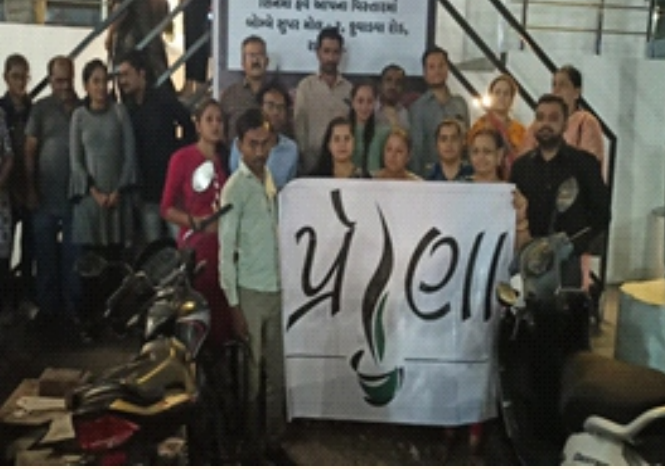
પ્રેરણા કાર્યક્રમ, રાજકોટ

ઈન્ડિયા રિનલ ફાઉન્ડેશન રાજકોટ ચેપ્ટર દ્વારા 'પ્રેરણા' કાર્યક્રમ અંતર્ગત ૧૧ જૂન રવિવારના રોજ કિડનીના દર્દીમિત્રોને કોસ્મો પ્લેક્સ સિનેમા, રાજકોટ ખાતે એક નિ:શુલ્ક મનોરંજક ફિલ્મ બતાવવામાં આવી હતી. જેનો ૫૦ થી પણ વધુ દર્દી મિત્રોએ તેમના સગાઓ સાથે ભાગ લીધો હતો.