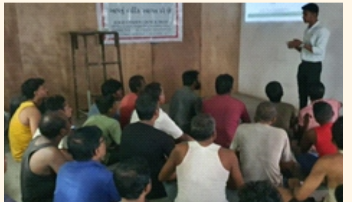
શિવ ટેક્સટાઇલ પ્રા. લિ., સચીન જી.આઈ.ડી.સી., જી.- સુરત