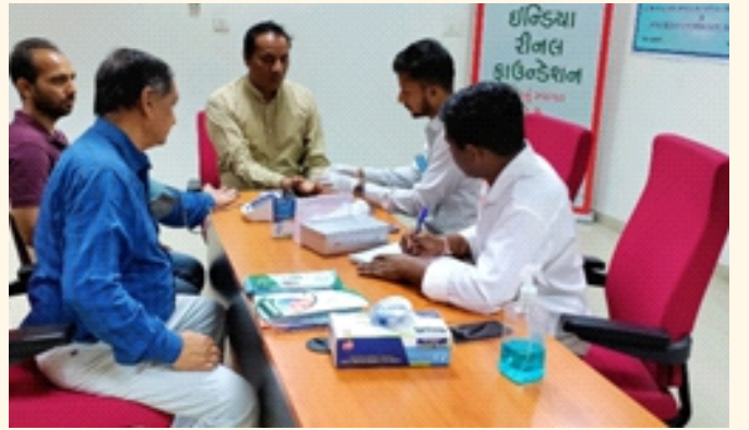
કોલેજ ઓફ હોર્ટીકલ્ચર, જગુદણ, મહેસાણા