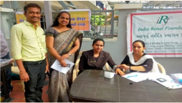
ગુરુકૃપા વિદ્યાલય, મોરા ભાગલ, સુરત