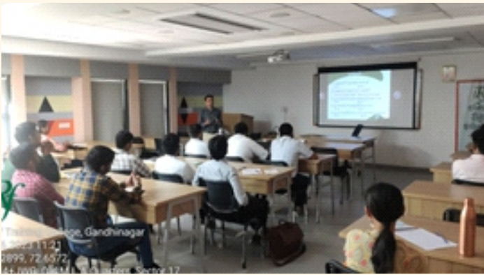
સ્ટાફ ટ્રેનિંગ કોલેજ, ગાંધીનગર