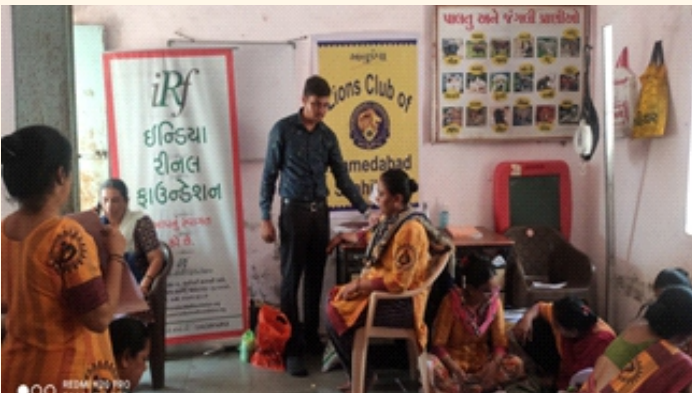
ગામ.-વડોદરા, જી.- ગાંધીનગર