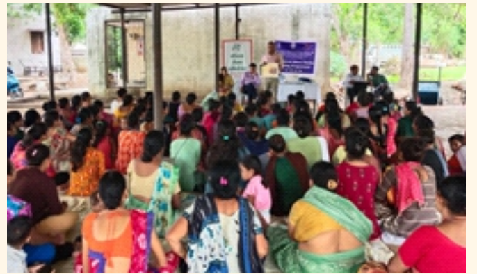
ગામ.-કારોડિયા, જી.- વડોદરા