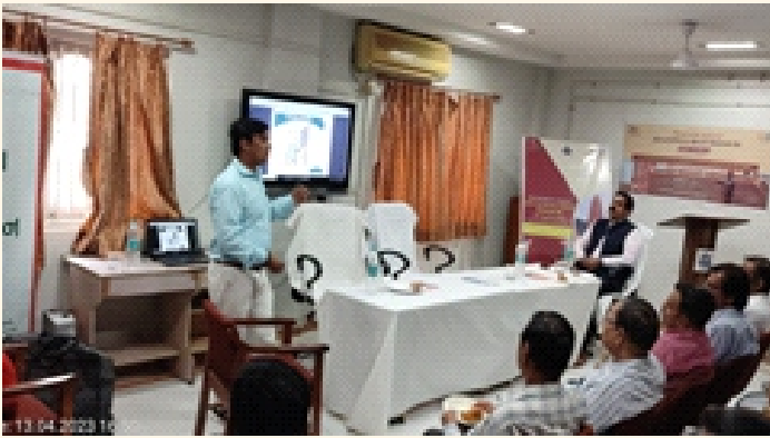
જી. એસ. ટી ઓફિસ, ભાવનગર