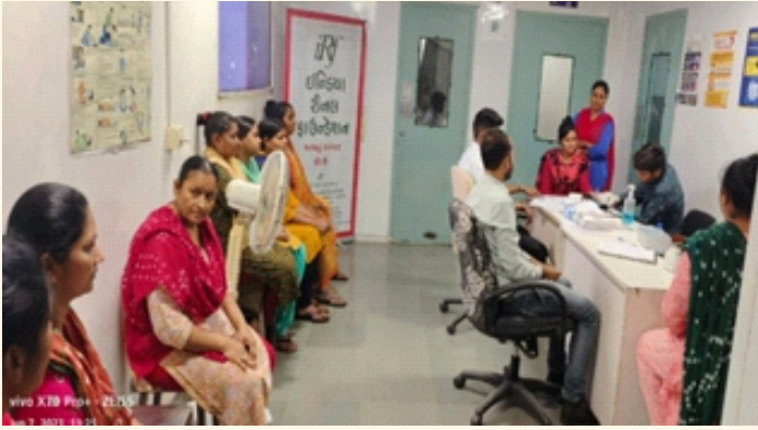
લિંકન ફાર્માસ્યુટિકલ લિમિટેડ, ખાત્રજ જી.આઈ.ડી.સી, ગાંધીનગર