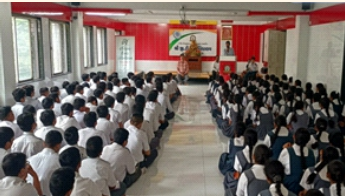
જી. ટી વિદ્યાલય , રાજકોટ