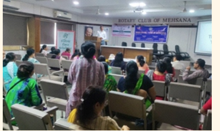
કાર્યક્રમના અંતે પ્રશ્નોત્તરી