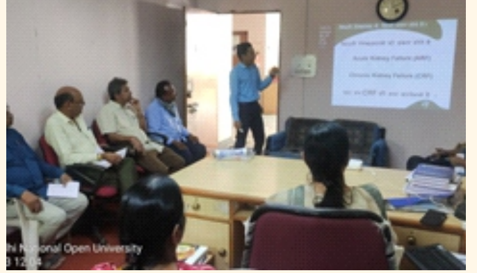
ઇન્દિરા ગાંધી નેશનલ ઓપન યુનિવર્સિટી, અમદાવાદ