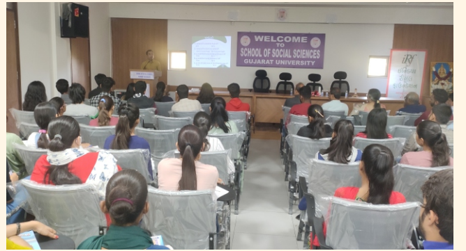
સ્કૂલ ઓફ સોશિયલ સાઈન્સ, ગુજરાત યુનિવર્સિટી, અમદાવાદ