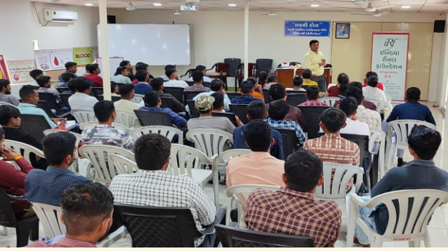
ઈન્ડિયન રેડક્રોસ સોસાયટી, ભાવનગર