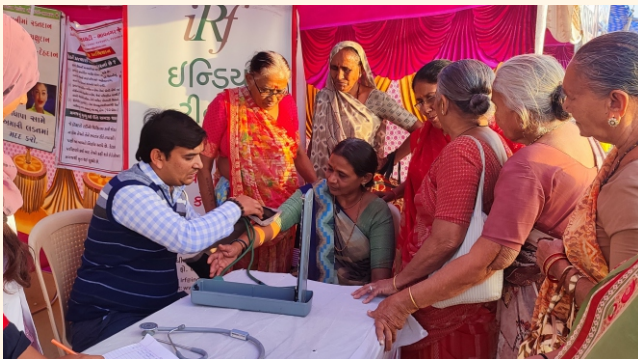
સુરભી ગૌશાળા, નારી ગામ, જી.- ભાવનગર