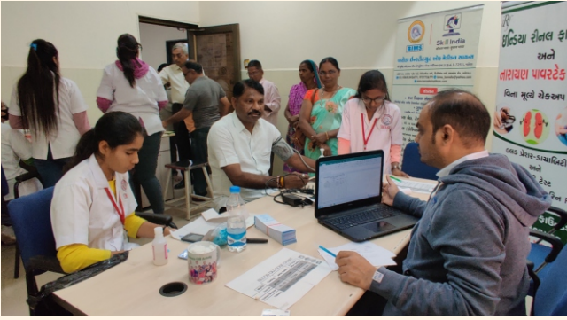
નેત્રંગ પ્રાથમિક આરોગ્ય કેન્દ્ર, જી.-ભરૂચ