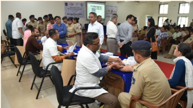
પોલીસ કમિશનર ઓફિસ, સુરત