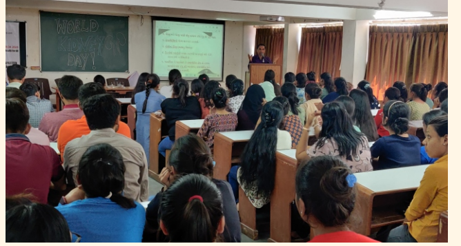
જે. જી નર્સિંગ કોલેજ, અમદાવાદ ખાતે અપેરનેસ પ્રોગ્રામ