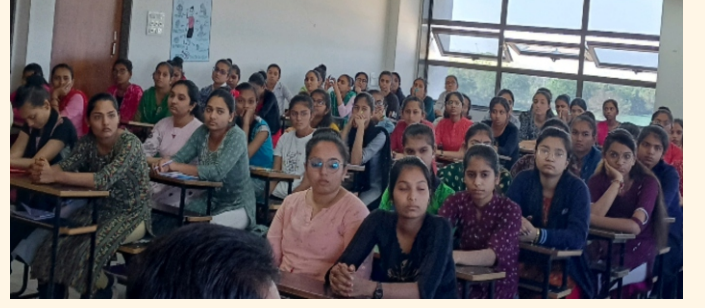
કામદાર નર્સિંગ કોલેજ, રાજકોટ