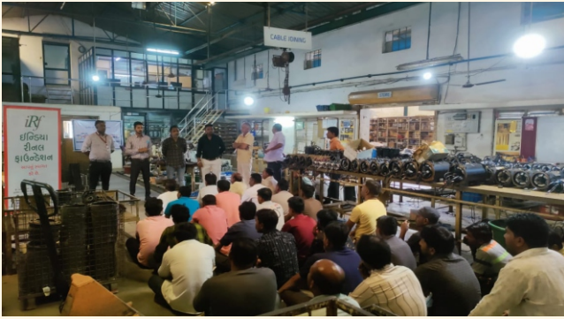
સોના પંપ્સ રીલાઇવ વોટર જી.આઈ.ડી.સી., ગામ- ઉબખલ, જી.- મહેસાણા