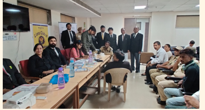
સીટી સિવિલ એન્ડ સેશન્સ કોર્ટ, અમદાવાદ ખાતે અવેરનેસ પ્રોગ્રામ અને કેમ્પ