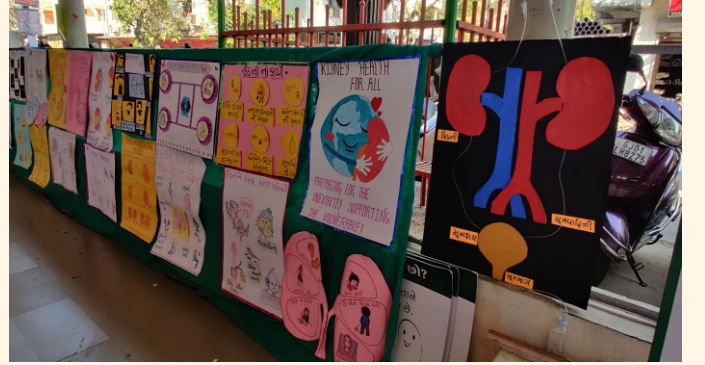
જે. જી. નર્સિંગ કોલેજની વિદ્યાર્થીનીઓ દ્વારા બનાવેલ કિડની જાગૃતિ પોસ્ટર્સ