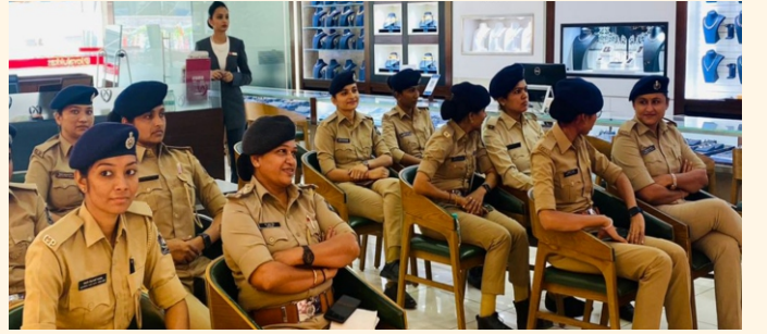
જોયાલુક્કાસ જ્વેલરી શો-રૂમ, વડોદરા