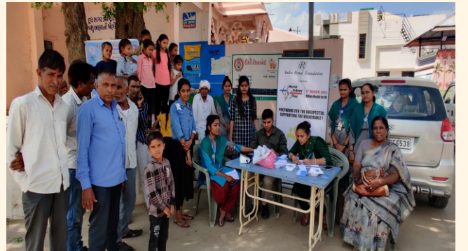
શંકરપુરા ગામ, તા. જી. - મહેસાણા