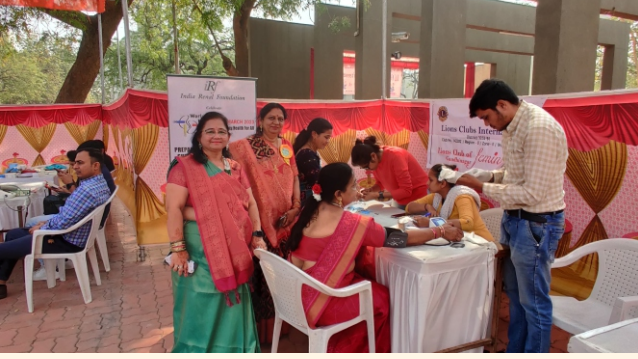
દિવ્યાંગ સમૂહ લગનોત્સવ, સેક્ટર-૨૨, ગાંધીનગર

આ કેમ્પનું આયોજન કરવાનો મુખ્ય ઉદ્દેશ હાયપરટેન્શન અને ડાયાબિટીસ જેવા બિનચેપી રોગોની શરીરના મહત્વના અંગો, ખાસ કરીને કિડની પર થતી ગંભીર અસરો અંગે જાગૃતિ લાવવાનો છે. અમારા કાર્યક્રમોની કાર્યક્ષમતા અને અસરકારકતા સુધારવા અમે સ્થાનિક સ્વયંસેવકોની પણ મદદ લઈએ છીએ.