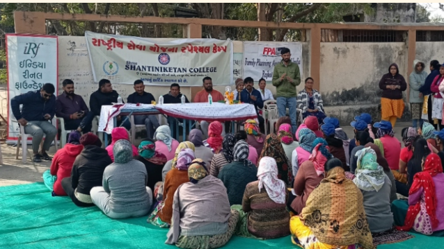
રામનગર ગામ, જી.- રાજકોટ