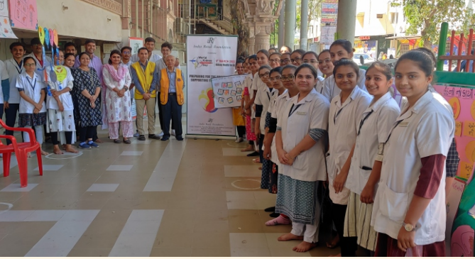
નીલકંઠ મહાદેવ મંદિર, ઘાટલોડિયા, અમદાવાદ ખાતે આયોજિત નિદાન કેમ્પ

વિશ્વ કિડની દિવસની ઉજવણીના ભાગરૂપે અમદાવાદમાં વિવિધ કાર્યક્રમોનું આયોજન કરવામાં આવ્યું હતું, જેમાં લાયન્સ ક્લબ ઓફ શાહીબાગ અને જે. જી. નર્સિંગ કોલેજના સંયુક્ત ઉપક્રમે ઈન્ડિયા રીનલ ફાઉન્ડેશન દ્વારા નીલકંઠ મહાદેવ મંદિર, ઘાટલોડિયા ખાતે નિ:શુલ્ક ડાયાબિટીસ અને બ્લડ પ્રેશર ચેકઅપ કેમ્પનું આયોજન કરવામાં આવ્યું હતું. આ કેમ્પમાં જે. જી. કોલેજના વિદ્યાર્થીઓ દ્વારા કિડની દિવસ નિમિત્તે કિડનીનું શરીરમાં મહત્વ, તેની રચના અને કિડનીને લગતા વિવિધ પ્રકારના રોગો વિષે વિવિધ જાગૃતિ પોસ્ટર્સ બનાવવામાં આવ્યા હતા જેના દ્વારા દર્શનાર્થીઓને કિડની અંગે વિશેષ સમજૂતી આપવામાં આવી હતી. આ કેમ્પમાં ૧૮૦ થી પણ વધારે નાગરિકોએ પોતાનું ચેકઅપ કરાવ્યું હતું.