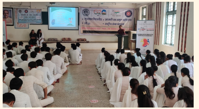
ગુજરાત વિદ્યાપીઠ, રાંધેજા, જી.-ગાંધીનગર