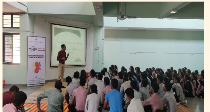
જિલ્લા શિક્ષણ અને તાલીમ સંસ્થાન, અમદાવાદ