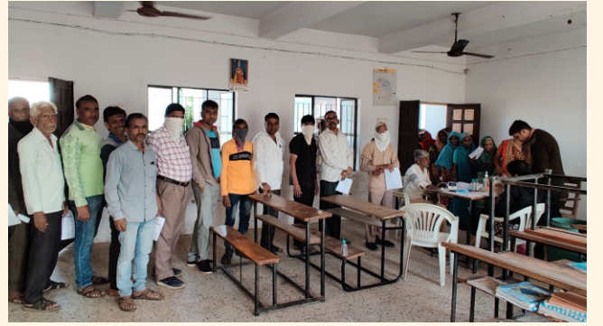
નૈનપુર ગામ, તા.-મહેમદાવાદ, જી.-ખેડા