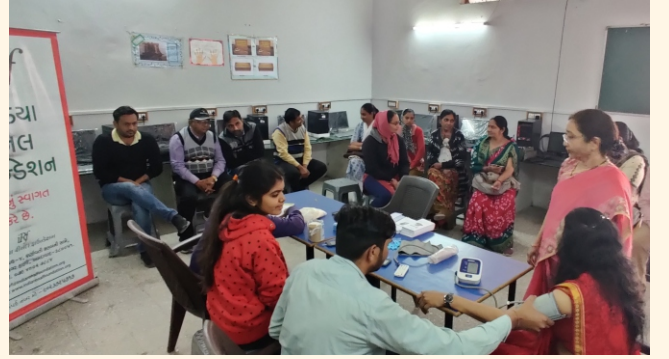
ધોળકા એજ્યુકેશન ટ્રસ્ટ, ધોળકા, જી.-અમદાવાદ