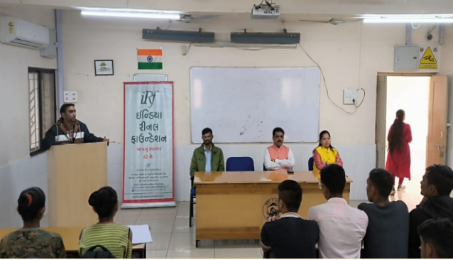
ડિપાર્ટમેન્ટ ઓફ સાઇકોલોજી, સૌરાષ્ટ્ર યુનિવર્સિટી, રાજકોટ