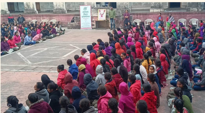
જી.ટી. ગર્લ્સ હાઈસ્કૂલ, રાજકોટ