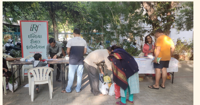
ઓર્ગેનિક ફૂડ અને શાકભાજી માર્કેટ, ગુજરાત વિદ્યાપીઠ, અમદાવાદ