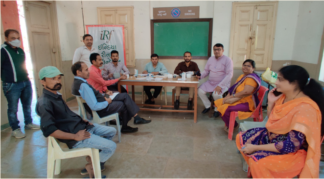
સી.એન. વિદ્યાલય, અમદાવાદ