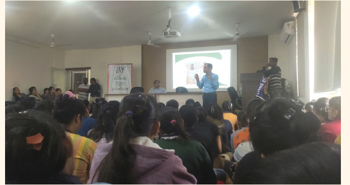
મહિલા આઈ.ટી.આઈ, મણીનગર, અમદાવાદ