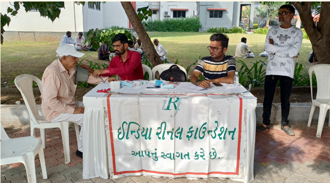
ડારી ગામ, જી.-રાજકોટ