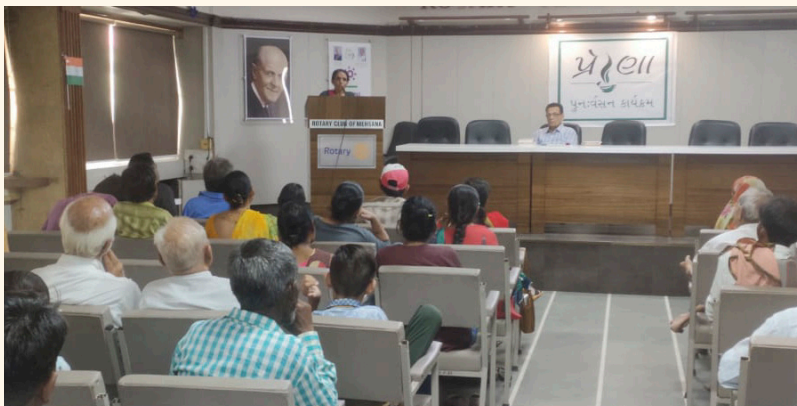
પ્રેરણા કાર્યક્રમ, મહેસાણા