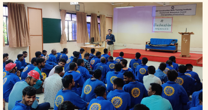
એલ એન્ડ ટી સ્કિલ ટ્રેનિંગ સેન્ટર, ચાંગોદર