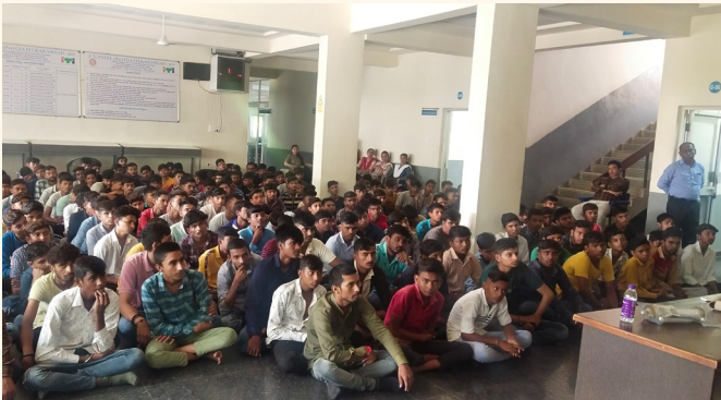
જે.વી. પટેલ આઈ.ટી.આઈ., કરમસદ, જી. આણંદ