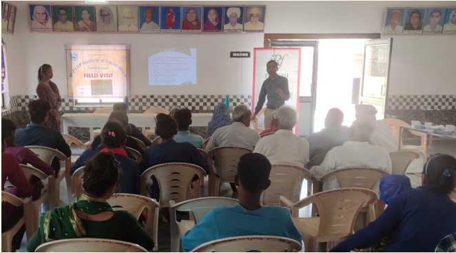
નારદીપુર ગામ, તા.જી. - ગાંધીનગર