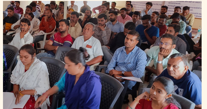
રેડ ક્રોસ સોસાયટી, ભાવનગર