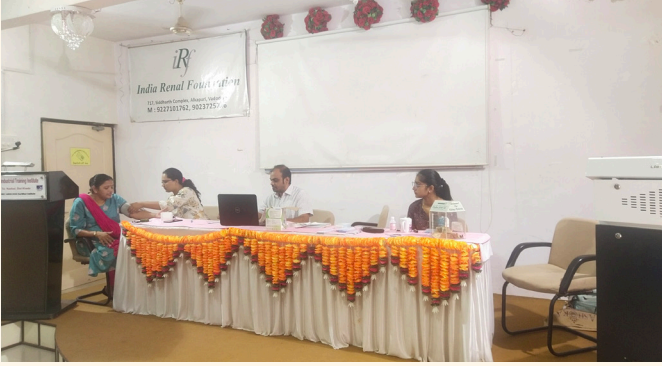
આઈ.ટી.આઈ., ઉત્તરસંડા, જી.-વડોદરા

આ કેમ્પનું આયોજન કરવાનો મુખ્ય ઉદ્દેશ હાયપરટેન્શન અને ડાયાબિટીસ જેવા બિનચેપી રોગોની શરીરના મહત્વના અંગો, ખાસ કરીને કિડની પર થતી ગંભીર અસરો અંગે જાગૃતિ લાવવાનો છે. અમારા કાર્યક્રમોની કાર્યક્ષમતા અને અસરકારકતા સુધારવા અમે સ્થાનિક સ્વયંસેવકોની પણ મદદ લઈએ છીએ.