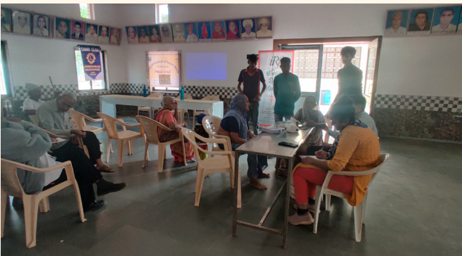
નારદીપુર ગામ, તા. જી. ગાંધીનગર