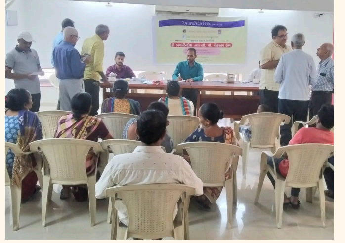
માધવપુરા માર્કેટ, શાહીબાગ, અમદાવાદ