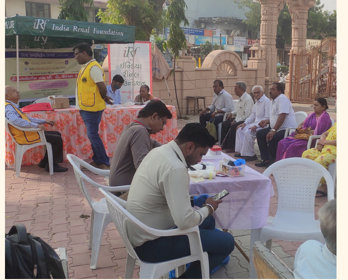
શ્રી રામેશ્વર મહાદેવ મંદિર, નિર્ણયનગર, અમદાવાદ