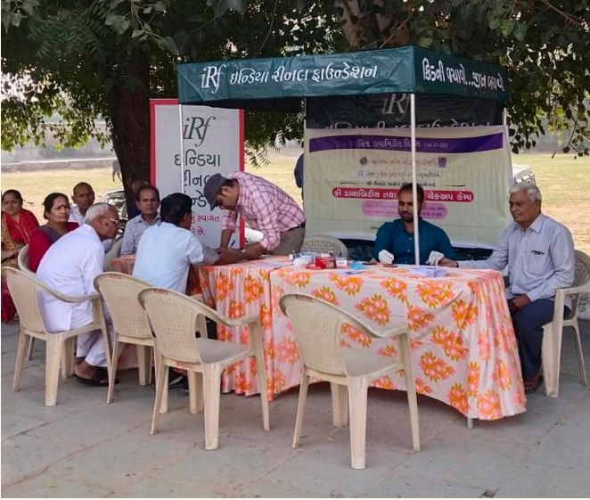
શ્રી નીલકંઠ મહાદેવ મંદિર, બલોલનગર, રાણીપ