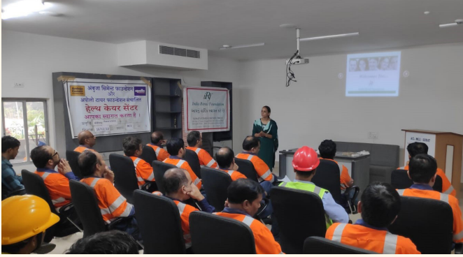
અંબુજા સિમેન્ટ પ્લાન્ટ, હજીરા, સુરત