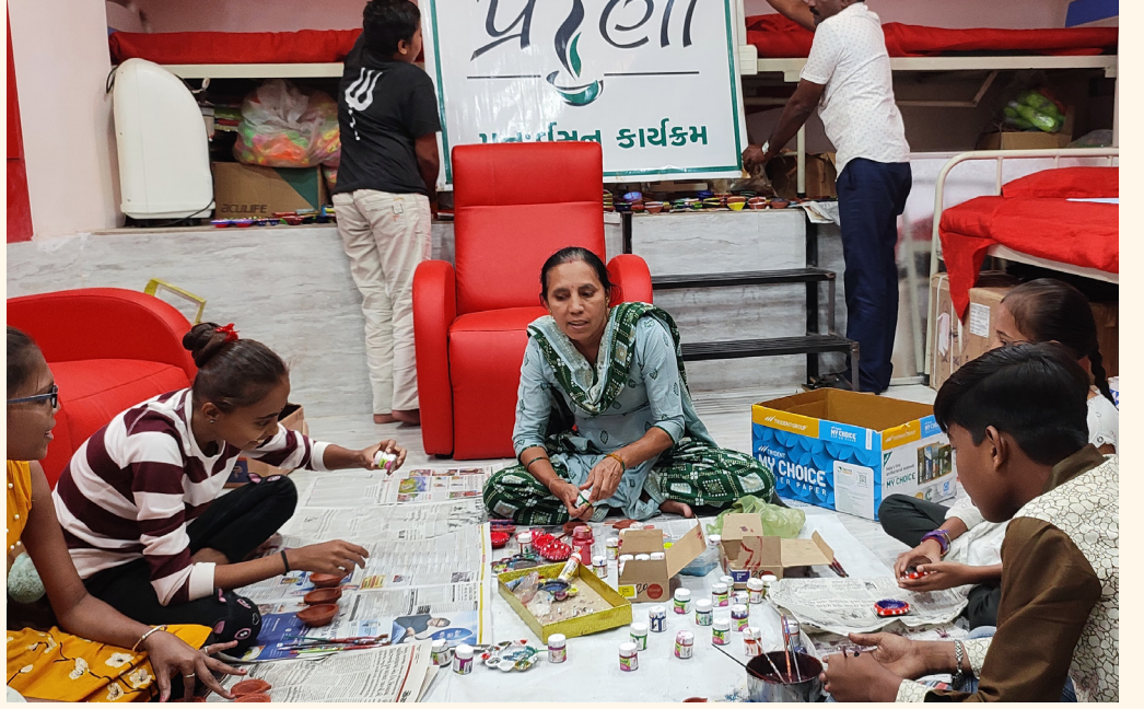
પ્રેરણા કાર્યક્રમ, ભાવનગર

ભાવનગર ચેપ્ટર ખાતે સંસ્થા દ્વારા દિવાળીના શુભ પર્વ નિમિત્તે પ્રેરણા સભ્યોને ફેન્સી ટીવા બનાવવા માટેની તાલીમ આપવામાં આવી હતી. ઘણા બધા દર્દી મિત્રો એ આ તાલીમમાં ઉત્સાહપૂર્વક ભાગ લીધો હતો અને ખૂબ જ સુંદર ફેન્સી ટીવા બનાવ્યા હતા. આ બનાવેલ ટીવાનું સંસ્થા દ્વારા વેચાણ કરવામાં આવ્યું હતું અને તેની રકમ પ્રેરણા સભ્યોને આપવામાં આવી હતી.