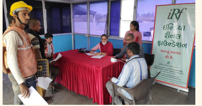
એસાર પ્લાન્ટ, હજીરા, સુરત