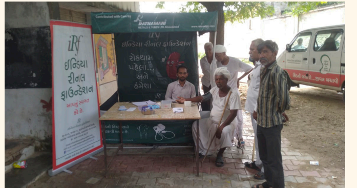
ડોડીવાળા ગામ તા. બેચરાજી, જી. મેહસાણા