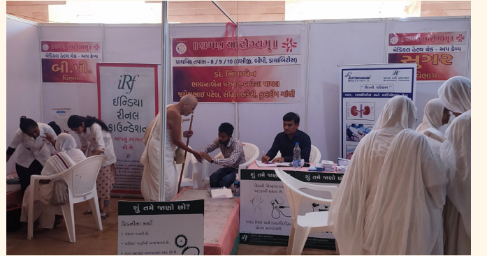
જૈન ટ્રેસર, પાલિતાણા, જી. ભાવનગર