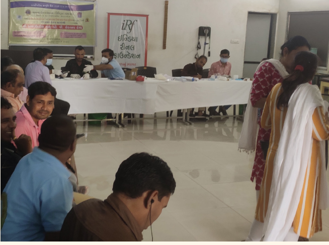
અંધ કલ્યાણ કેન્દ્ર, રાણીપ, અમદાવાદ