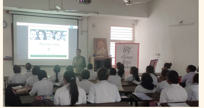
ઉમિયા નર્સિંગ કોલેજ, સોલા, અમદાવાદ