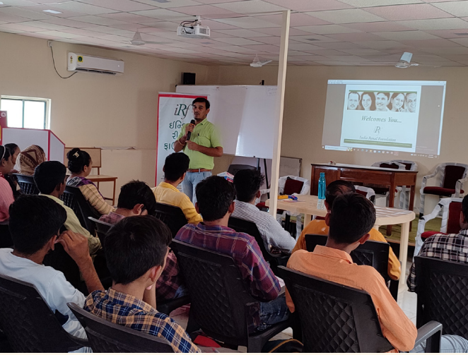
રેડક્રોસ સોસાયટી, ભાવનગર