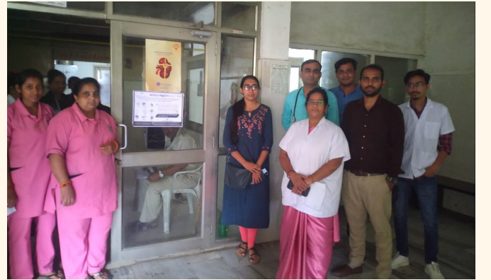
લાયન્સ જનરલ હોસ્પિટલ, મહેસાણા ખાતે ICU માં રાખેલ અંગદાન જાગૃતિ પોસ્ટર