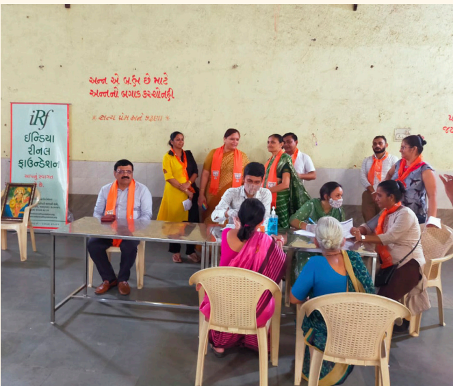
વશાની વાડી, નાના વરાછા, સુરત