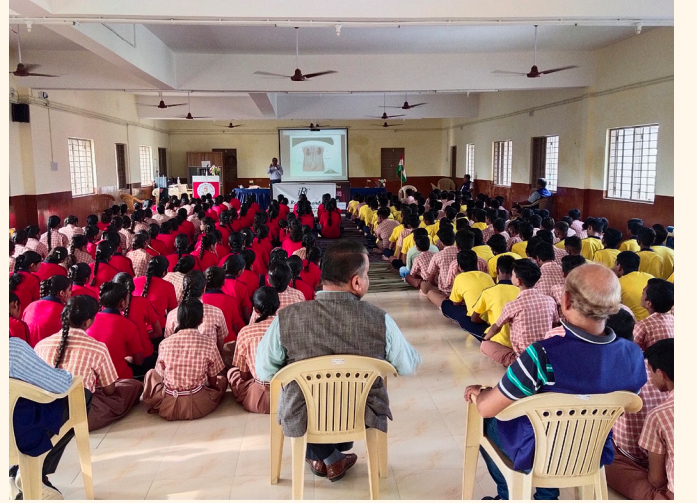
સત્યનારાયણ વિદ્યાલય, વડોદરા