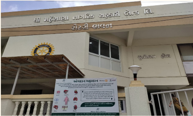
રોટરી ક્લબ ઓફ મહેસાણા ખાતે કાયમી ધોરણે મુકેલ હોર્ડિંગ્સ

આ શહેરમાં વિવિધ ખ્યાતનામ હોસ્પિટલોના ICU માં કેડેવરિક અંગદાનની માહિતી આપતા અને સંસ્થાના અધિકારીના નંબર સાથેના પોસ્ટર લગાવીને ICU ના સ્ટાફને આ વિષે જાગૃત કરવામાં આવ્યા હતા. તેમજ રોટરી ક્લબ ઓફ મહેસાણા (યુનિકાકા હોલ) ખાતે કાયમી ધોરણે અંગદાન જાગૃતિ પોસ્ટર લગાવવામાં આવ્યું.