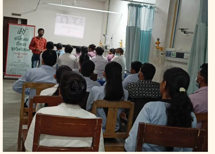
આદિત્ય બિરલા હોસ્પિટલ, વેરાવળ, સોમનાથ