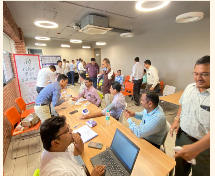
રતનમણી મેટલ્સ એન્ડ ટ્યુબ્સ લિમિટેડ, અમદાવાદ