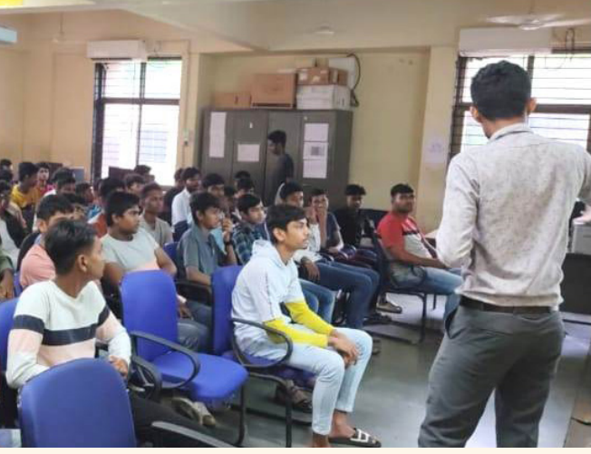
આઈ. ટી. આઈ. સચીન, સુરત