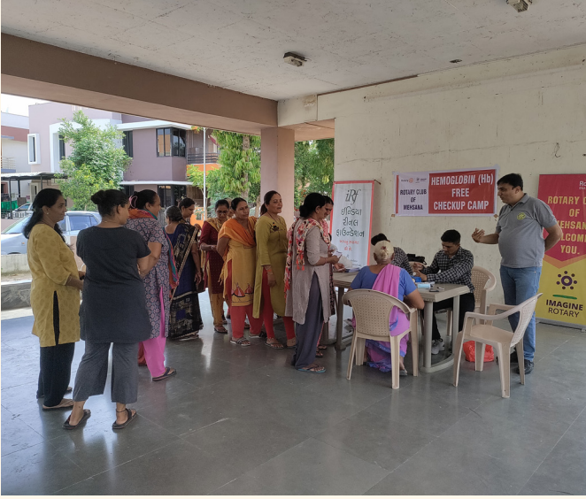
કુશાલ રેસિડેન્સી, મહેસાણા