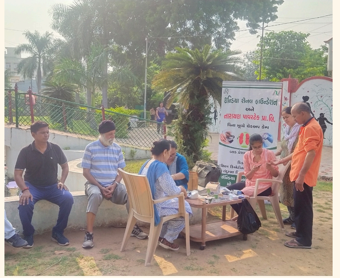
ડો. હેડગેવર ગાર્ડન, વડોદરા