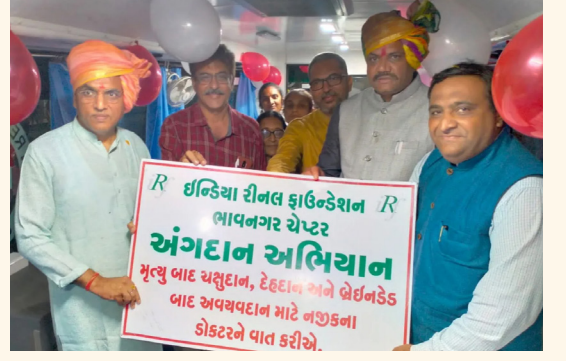
જીવનદાન કાર્યક્રમને પ્રોત્સાહિત કરતા ભારત સરકારના આરોગ્ય મંત્રી શ્રી ડો. મનસુખભાઈ માંડવિયા તેમજ ગુજરાત રાજ્યના શિક્ષણ મંત્રી શ્રી જીતુભાઈ વાઘાણી

આ ઉપરાંત વિશુદ્ધાનંદ વિદ્યામંદિરના વિદ્યાર્થીઓના સહયોગથી સાચકલ રેલી દ્વારા શહેરના વિવિધ માર્ગો ઉપર અંગદાન જાગૃતિનો સંદેશ આપતી માહિતી પુસ્તિકાઓનું વિતરણ કરવામાં આવ્યું તેમજ તળાજા તાલુકાના અલંગ ગામ ખાતે કેડેવરિક અંગદાન જાગૃતિ સેમીનાર યોજવામાં આવ્યો હતો.