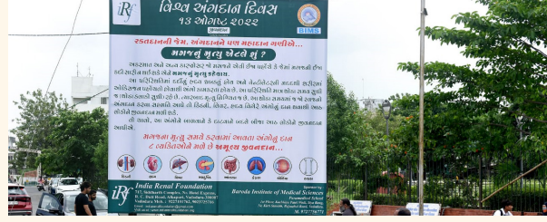
માંજલપુર ચાર રસ્તા, વડોદરા ખાતે હોર્ડિંગ્સ

અંગદાન દિવસ નિમિત્તેની ઉજવણીના ભાગરૂપે શહેરના સૌથી વ્યસ્ત ચાર રસ્તાઓ પર કેડેવરિક અંગદાન વિષે માહિતી આપતા હોર્ડિંગ્સ મૂકવામાં આવ્યા હતા. અને જાહેર જનતાને કેડેવરિક અંગદાન કરવા માટે પ્રોત્સાહિત કરવાનો પ્રયાસ કરવામાં આવ્યો હતો.