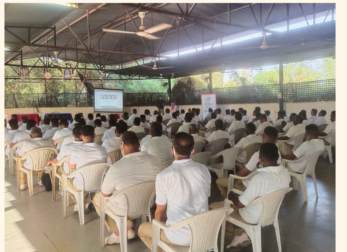
પોલીસ હેડક્વાર્ટર્સ, વડોદરા