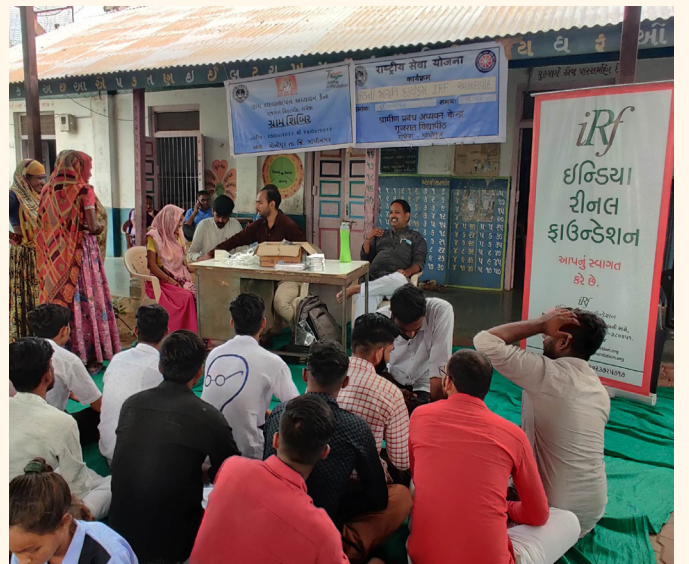
સોનીપુર ગામ તા. જી. ગાંધીનગર