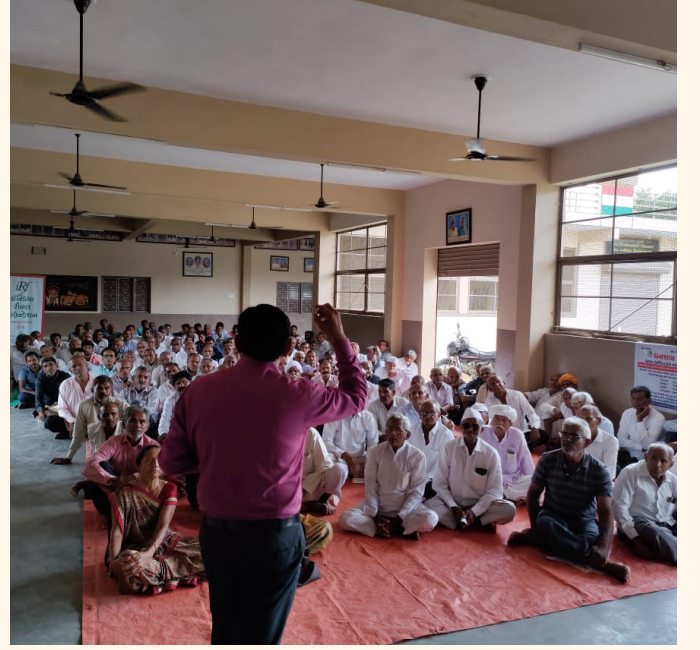
શ્રોતાઓને કિડની વિષે માહિતી આપતા ડોક્ટર