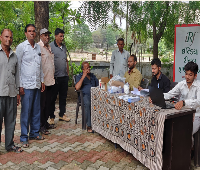
મિલેશ્વરપુરા ગામ તા. કલોલ, જી. ગાંધીનગર