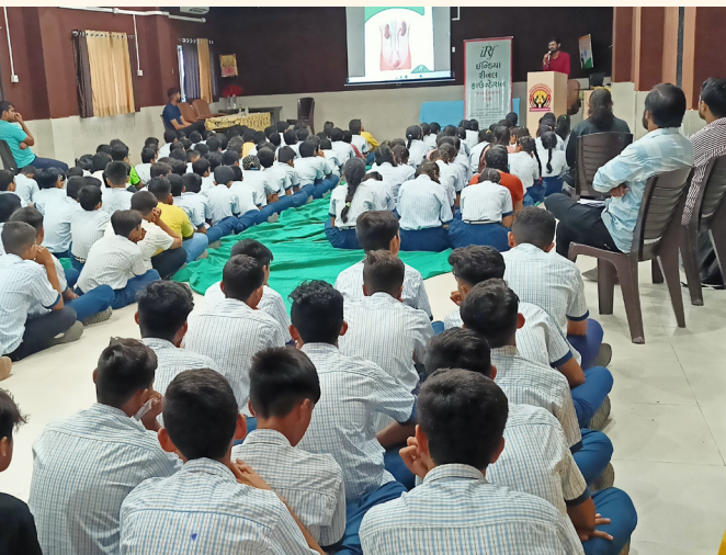
શિશુ મંદિર ઈન્ટરનેશનલ સ્કૂલ, સોમનાથ