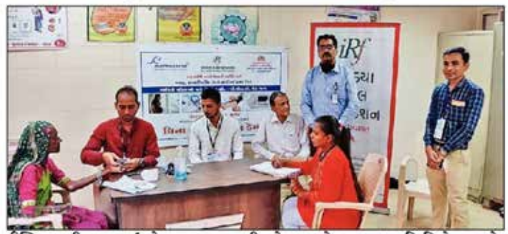
ઈન્ડિયા રિનલ ફાઉન્ડેશન, રત્નમણી મેટલ એન્ડ ટયુબ લિમિટેડ અને પ્રાથમિક આરોગ્ય કેન્દ્ર ભીમાસર દ્વારા પીએસસીમાં આવતા આઠ ગામના નાગરિકો માટે વિનામૂલ્યે કિડની જાગૃતિ કમર્ગકમ તેમજ બીપી, ડાયાબીટીસ અને કિડની માટેના તબીબી પરિક્ષણ કેમ્પનું આયોજન કરવામાં આવ્યું હતું આ કેમ્પ તા. ૧૫ સુધી સવારે ૯ થી ૧૨ ચાલશે.