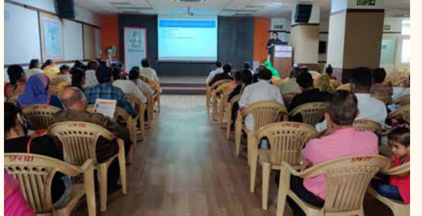
પ્રેરણા કાર્યક્રમ, અમદાવાદ

અમદાવાદ ચેપ્ટરના પ્રેરણા સભ્યો માટે ૨૩ એપ્રિલના રોજ સદ્વિચાર પરિવાર, સેટેલાઈટ, અમદાવાદ ખાતે પ્રેરણા કાર્યક્રમનું આયોજન કરવામાં આવ્યું હતું. આ કાર્યક્રમમાં અમદાવાદ શહેરના જાણીતા નેફ્રોલોજિસ્ટ ડૉ. ઉમેશભાઈ ગોધાણીને વક્તા તરીકે આમંત્રિત કરવામાં આવ્યા હતા. તેમણે હિમોડાયલિસીસની અને કિડની ટ્રાન્સપ્લાન્ટની સારવાર દરમિયાન કિડનીના દર્દીઓને પડતી મુશ્કેલીઓ અને તેના ઉકેલ વિશે ચર્ચા કરીને પ્રેરણા સભ્યોને મુંજવતા પ્રશ્નોના સંતોષકારક જવાબ આપ્યા હતા આ કાર્યક્રમમાં ૬૪ પ્રેરણાના સભ્યોએ તેમના સંબંધીઓ સાથે ભાગ લીધો હતો.