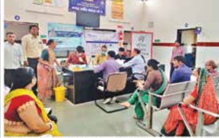
ઈન્ડિયા રિનલ ફાઉન્ડેશન દ્વારા તાજેતરમાં નિદાન કેમ્પનું આયોજન કરવામાં આવ્યું હતું. પાનસર ખાતે યોજાયેલા કેમ્પમાં ડાયાબીટીસ, બીપી તથા અન્ય રોગોની તપાસ કરીને કિડનીના રોગો વિશે માહિતી આપતી પુસ્તિકા પ્રાપ્તિનો આપી જાગૃત કરવામાં આવ્યા હતા.