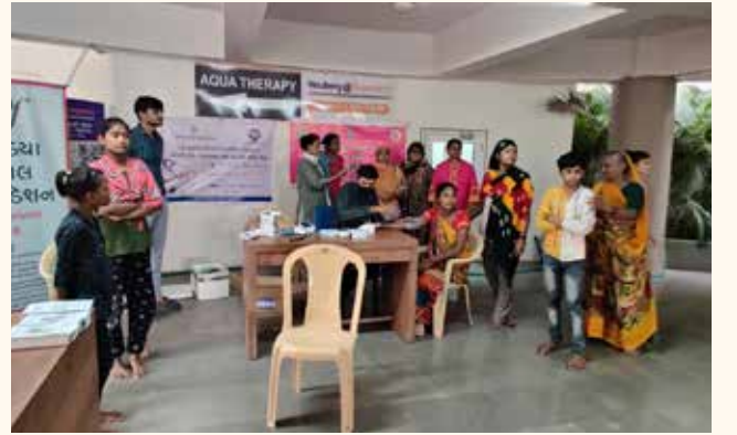
અખંડ જ્યોત ફાઉન્ડેશન, અમદાવાદ