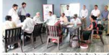
વરસામેડી ખાતે સાયેલ શાંતિઘાટમાં ભીમાસર પીએસસી અને રત્નમણી ઠંપની તથા લેબલ ફાઉન્ડેશન ગ્રુપ દ્વારા સર્વ સેગ નિદાન કેમ્પ યોજવામાં આવ્યો હતો. જેમાં કુલથી ૮૦ દર્દીઓએ લાભ લીધો હતો. બ્લડ ગ્રુપ, બીપી, ડાયાબિટીસ અને હૃદયનો કાર્યગ્રામ તથા ગ્લાયસેન ડોઝર દ્વારા એનલીબી એનલી સેકલપ કલ્ચરમાં રાખ્યું હતું અને વડદી સલાહ સુચન અને દવાઓ પણ આપવામાં આવી હતી.