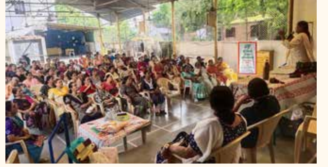
સરદારનગર મહિલા મંડળ, વડોદરા