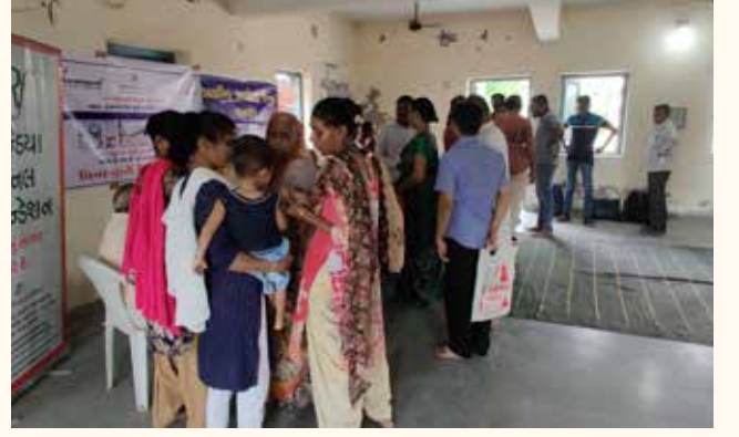
છત્રાલ ગામ તા. કલોલ, જી. ગાંધીનગર