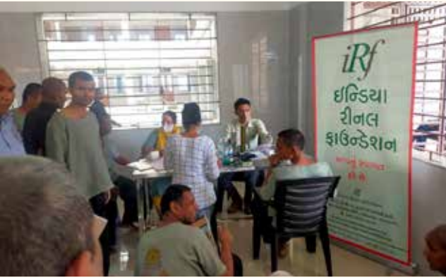
માનવ સેવા ચેરિટેબલ ટ્રસ્ટ, સુરત