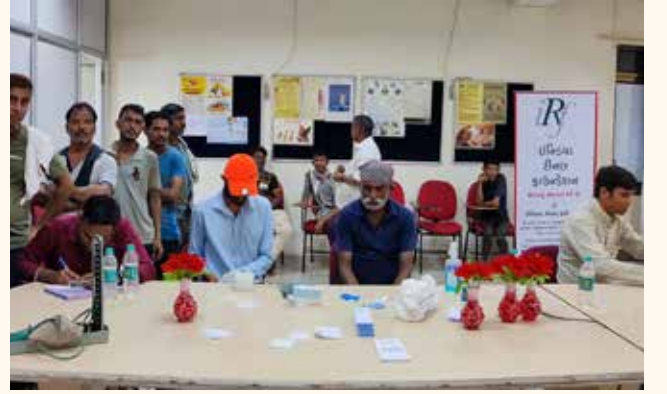
રતનમણી મેટલ એન્ડ ટ્યુબ લિમિટેડ, કચ્છ-ભુજ યુનિટ