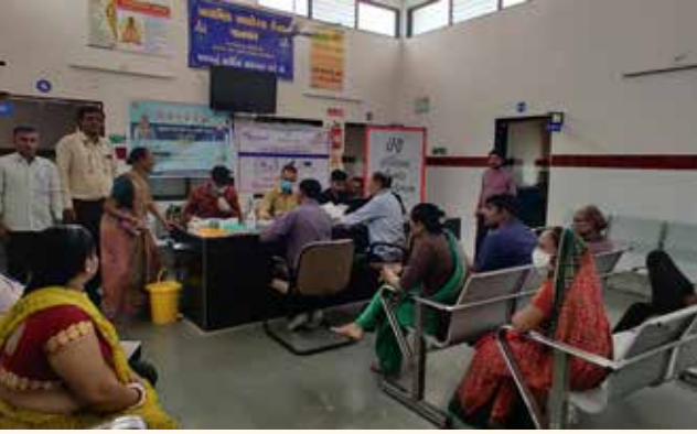
પાનસર ગામ તા. કલોલ, જી. ગાંધીનગર