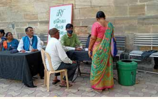
અરવિંદ મણિયાર હોલ, રાજકોટ