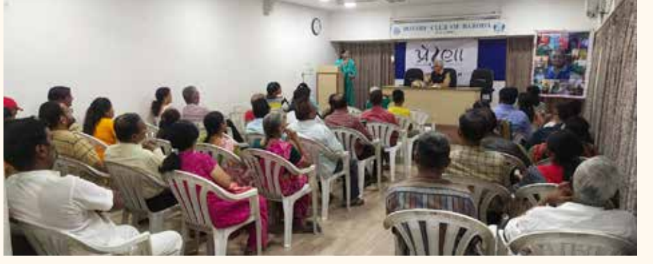
પ્રેરણા કાર્યક્રમ, વડોદરા

આ સમય દરમિયાન વડોદરા ચેપ્ટરના પ્રેરણા મિત્રો માટે પ જૂનના રોજ રોટરી ક્લબ, જૂના પાદરા રોડ, વડોદરા ખાતે પ્રેરણા કાર્યક્રમનું આયોજન કરવામાં આવ્યું હતું. આ કાર્યક્રમમાં ડો. રાજેન્દ્રભાઈ હાથી, એક હાસ્યલેખકને વક્તા તરીકે આમંત્રિત કરવામાં આવ્યા હતા. તેમણે રમૂજી પ્રસંગો અને જોકસ રજૂ કરીને પ્રેરણા સભ્યોનું મનોરંજન કરાવ્યું હતું.