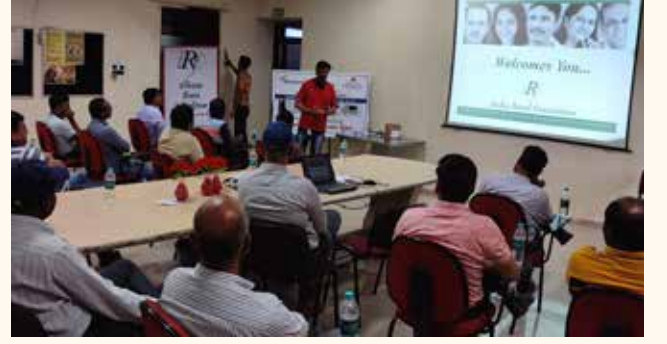
રત્નમણી મેટલ એન્ડ ટ્યુબ લિમિટેડ, કર્ણ-ભુજ યુનિટ