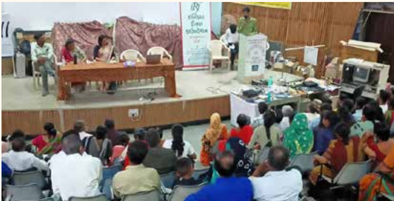
પ્રેરણા કાર્યક્રમ, રાજકોટ