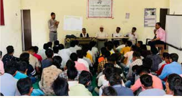
આઈ. ટી. આઈ., બારડોલી