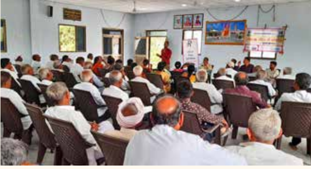
ખેડૂત તાલીમ કેન્દ્ર, વિસનગર