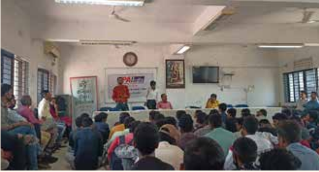
આઈ. ટી. આઈ., ગોંડલ