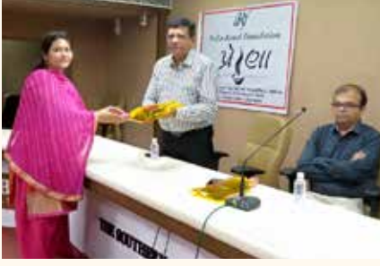
પ્રેરણા કાર્યક્રમ, સુરત