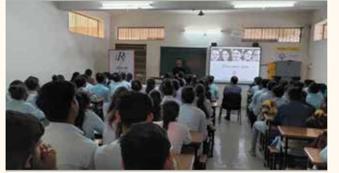
એમ. બી. કર્ણાવત કોલેજ, પાલનપુર