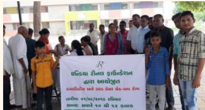
લુણાવાળા ગામ ખાતે નિદાન કેમ્પ