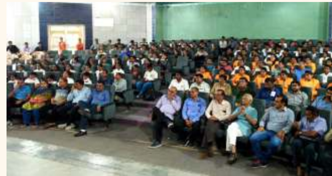
સોરાષ્ટ્ર યુનિવર્સિટી, સોરાષ્ટ્ર

આ ત્રિમાસિક ગાળા દરમિયાન ૧૯૯ જાગૃતિ અને નિદાન કેમ્પનું આયોજન કરવામાં આવ્યું હતું.