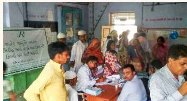
અણદેજ ગામ ખાતે નિદાન કેમ્પ