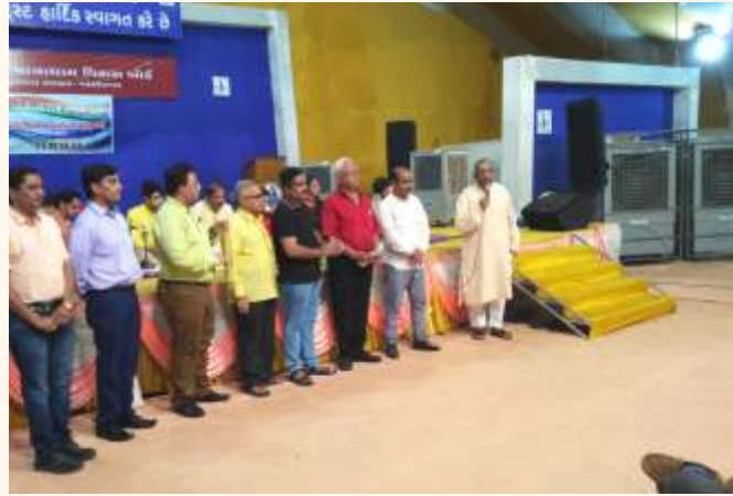
ગીર-સોમનાથ ચેપ્ટરના સલાહકાર સમિતિના સભ્યશ્રીઓ