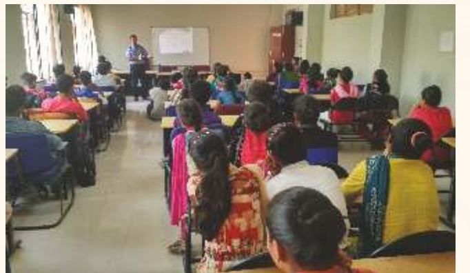
આઈ. ટી. આઈ, ભુજ