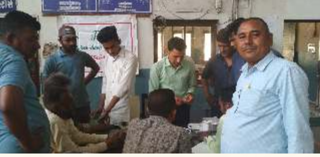
ડિવિઝનલ વર્કશોપ, હિમ્મતનગર