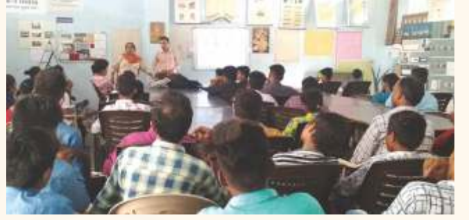
સદવિચાર પરિવાર ઉવારસદ ગામ