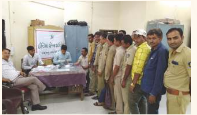
જી.એસ.આર.ટી.સી. બસ સ્ટોપ, કડી