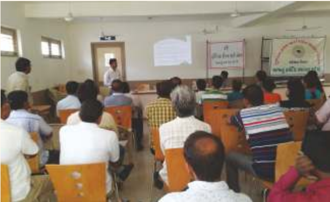
જી.એસ.આર.ટી.સી. ડિવિઝનલ ઓફિસ, મહેસાણા