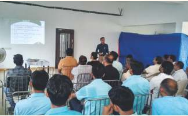
બાયર કોપ સાયન્સ લિમિટેડ, હિંમતનગર