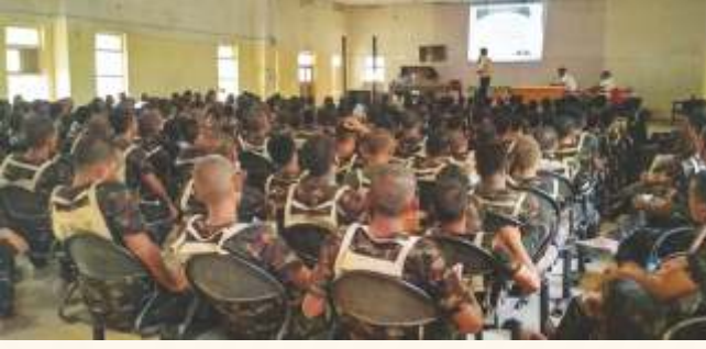
પોલીસ ટ્રેઈનીંગ સ્કૂલ, જૂનાગઢ