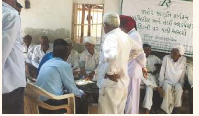
ખોડા ગામ ખાતે નિદાન કેમ્પ

આ ત્રિમાસિક ગાળા દરમિયાન ૧૩૬ લોકજાગૃતિ અને નિદાન કેમ્પ યોજાયા હતા