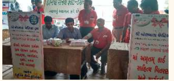
જૂનાગઢ ખાતે પ્રદર્શન