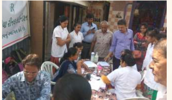
નિદાન કેમ્પ, ભાવનગર