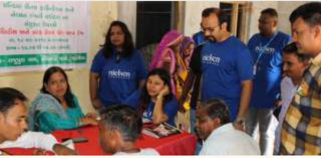
રાજપુરા ખાતે નિદાન કેમ્પ