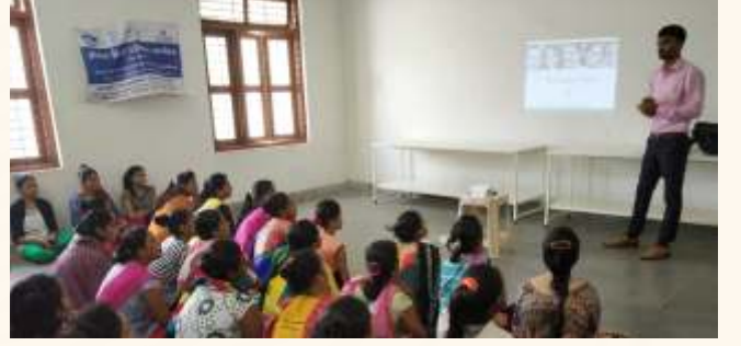
અંબુજા સિમેન્ટ ફાઉન્ડેશન, સુરત