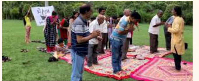
યોગા કાર્યક્રમ, વડોદરા

'પ્રેરણા' કાર્યક્રમ મારા માટે એક તહેવાર જેવો હોય છે, અને મને ખાતરી છે કે માત્ર મારા માટે જ નહિ, પરંતુ મારા બધા જ દર્દી મિત્રો જે સમગ્ર રાજ્યમાં આ કાર્યક્રમનો દર બે મહિને આનંદ માણે છે તે બધાની પણ આ જ લાગણી હશે.