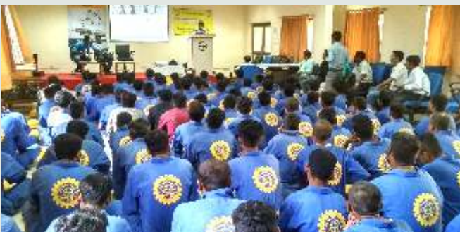
L & T સ્કીલ ડેવલપમેન્ટ ટ્રેઇનિંગ સેન્ટર