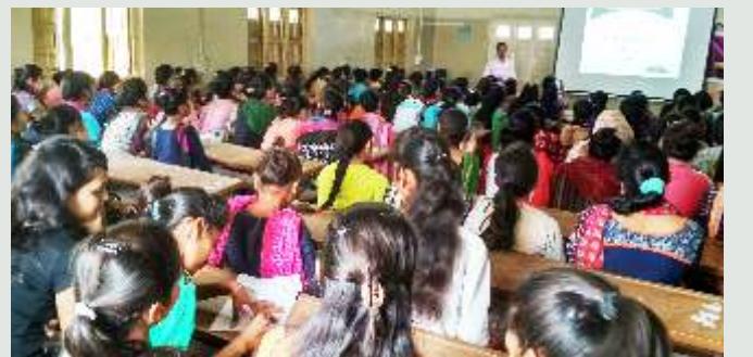
સાર્વજનિક મહિલા કોલેજ, મહેસાણા