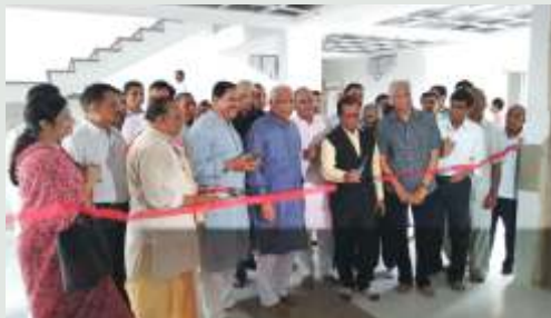
ડાયાલિસીસ સેન્ટરનુ ઉદ્ઘાટન