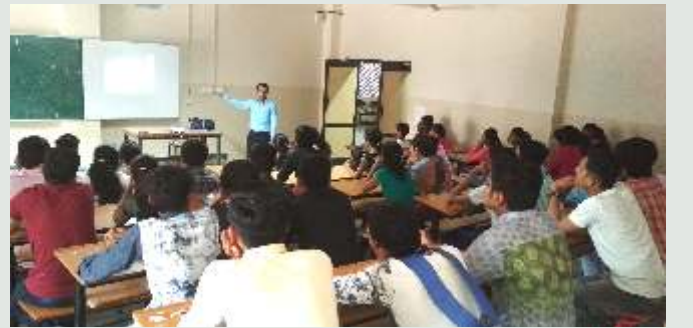
કાંતિગુરુ શ્યામજી કૃષ્ણ વર્મા કરછ યુનિવર્સિટી, ભુજ