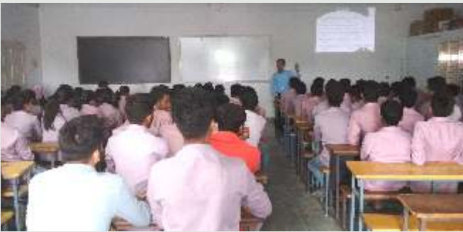
બનાસકાંઠા જિલ્લા કેળવણી મંડળ, પાલનપુર