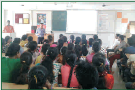
શ્રી એસ.એસ. પટેલ બી.એડ કોલેજ, ગાંધીનગર