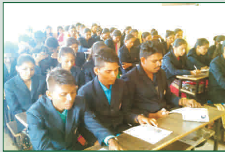
જે.કે. સરવૈયા કોલેજ, ભાવનગર