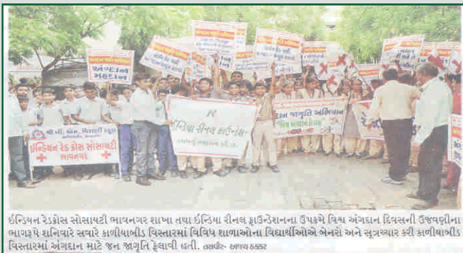
ભાવનગર ખાતે અંગદાન જાગૃતિ રેલી