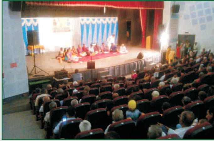
ભાવનગર ખાતે નાટકનો આનંદ લેતા દર્દી મિત્રો

કિડનીના દર્દીઓ માટેનો પુનઃવર્સન કાર્યક્રમ 'પ્રેરણા' પણ દરેક ચેપ્ટર ખાતે નિયમિત પણે કરવામાં આવ્યા