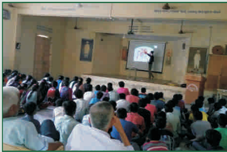
બાસણા ગામ, મહેસાણા