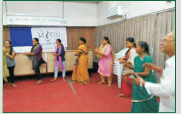
વડોદરા ખાતે સંગીતના કાર્યક્રમનો આનંદ માણતા દર્દી મિત્રો