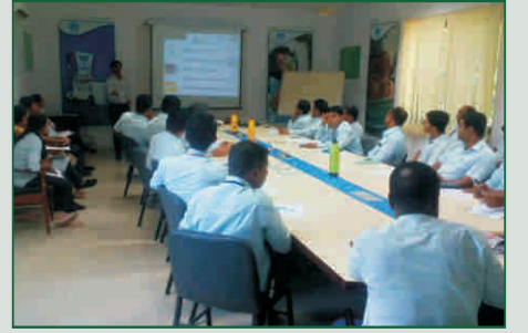
મધર ડેરી, જૂનાગઢ