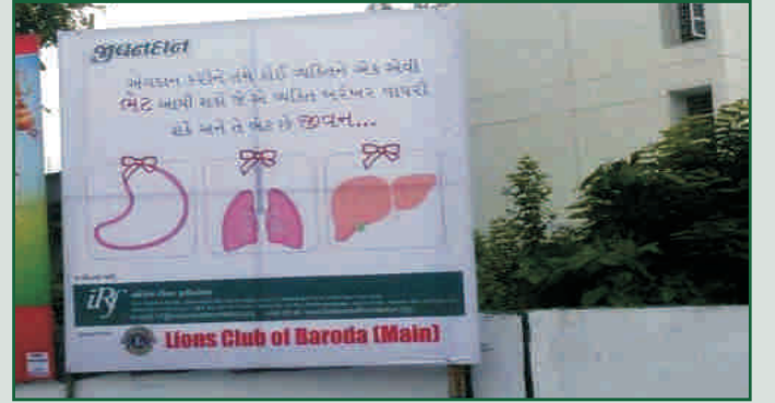
સેફ્ટોન કોમ્પ્લેક્ષની સામે, ફતેહગંજ, વડોદરા