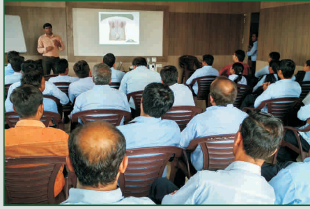
ગોપાલ ડેરી, રાજકોટ