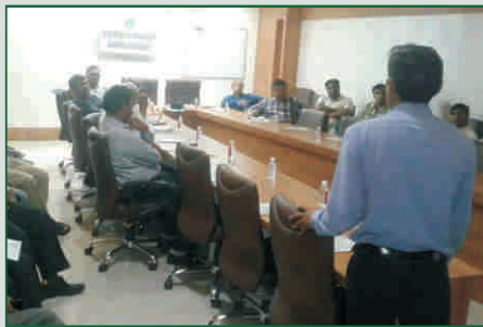
એસ.બી.આઈ. ઓવરસીઝ બ્રાન્ચ, અમદાવાદ