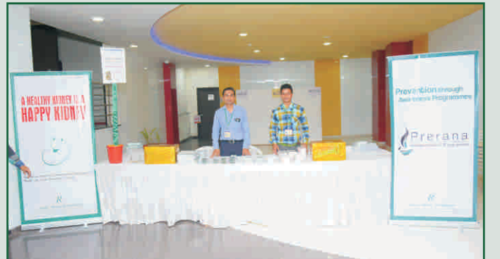
સંસ્થાની પ્રવૃત્તિઓનું પ્રદર્શન