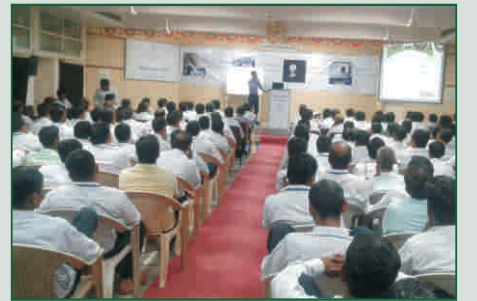
સમર્થ ડાયમંડ, વિસનગર