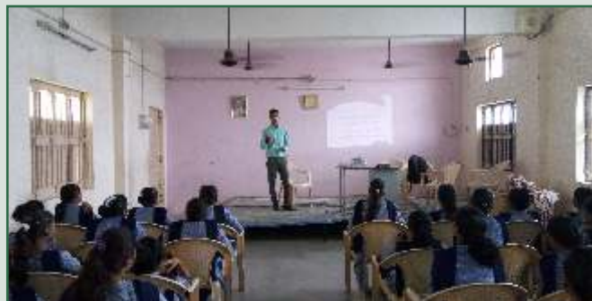
સિધ્ધાર્થ સ્કૂલ, મહેસાણા