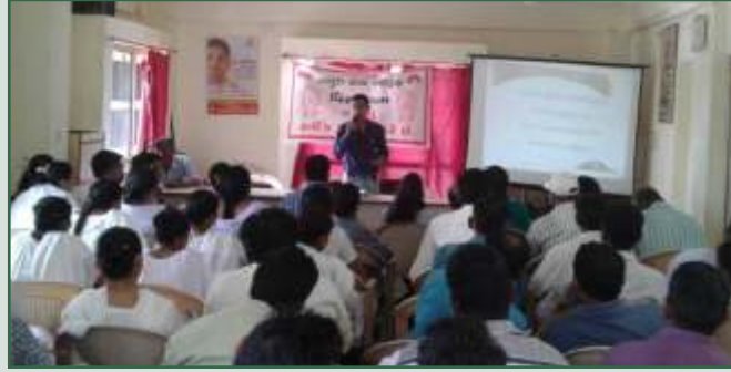
તાલુકા હેલ્થ ઓફિસ, વિરમગામ

અમદાવાદ જિલ્લામાં આ કાર્યક્રમો તાલુકા હેલ્થ ઓફિસ સાથે રહીને સાણંદ અને વિરમગામ ખાતે કરવામાં આવ્યા હતા.