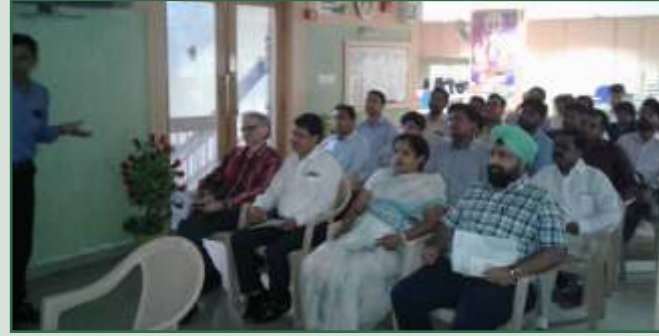
દેના બેંક ઝોનલ ઓફિસ, ગાંધીનગર