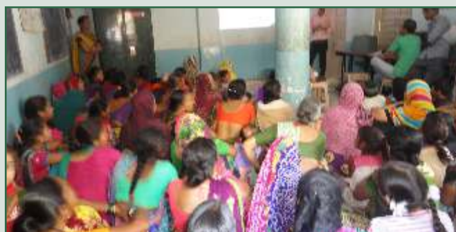
એસ.એચ.જી. ગ્રુપ, સુરત