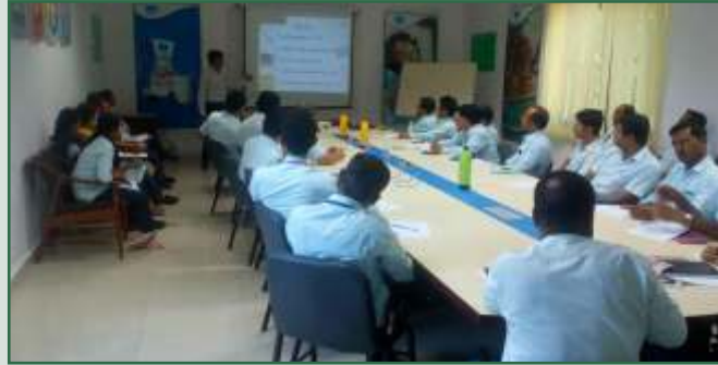
મધુર ડેરી, જૂનાગઢ