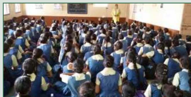
ચોકસી કે.કે. કન્યા હાઈસ્કૂલ, પાદરા